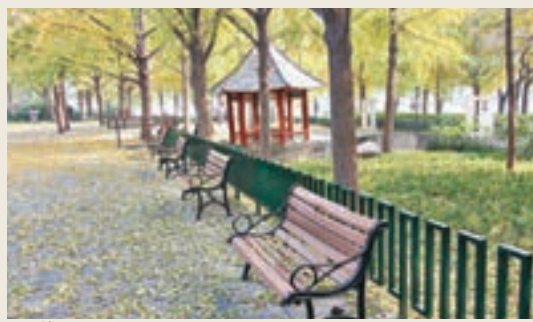
滿地落葉，空空的椅子。

還是回到銀杏樹，那天早上，想去紫竹院公園看看，慢慢走過去，穿過行人隧道，走到對面。一看，紫竹院竟給圍板圍住，看不見裡面的樣貌。看着「紫竹院路」的路牌，我們發愣。天氣報告說，該天天氣是零度到15度，此時大約還不至於零度，但對於我們而言，實在不宜久留，還是回去吧，於是又沿着兩旁在陽光下金燦燦的銀杏樹葉，踱着回酒店去了。