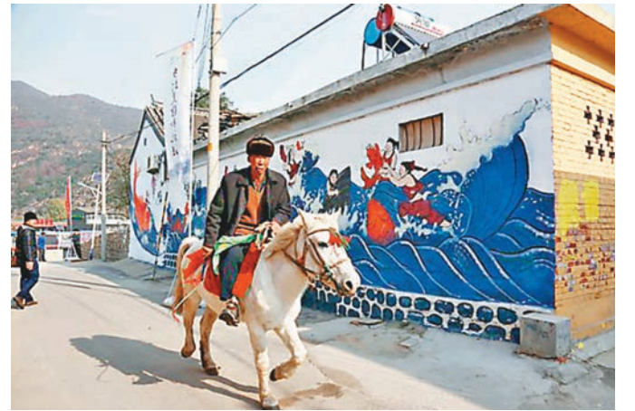
大水峪村的壁畫村景。