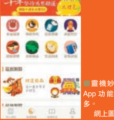
靈機妙算App功能繁多。網上圖片

靈機文化旗下「靈機妙算」App是一個融合傳統與科技的線上文化平台，目前擁有用戶超過1億，覆蓋全球48個國家及地區。「靈機妙算」集各家之大成，中西合璧，是市場上唯一一個涵括超過100款測算App的綜合平台。用戶只需下載一個主App，即可找到超過100款的支線App，包括紫微斗數、八字算命、風水運程、星座命理、塔羅、性格分析、占星等。各款支線App皆源自生活，例如為情侶而設的「生肖配對」、「姓名配對」，融入西方測算元素的「星座運程」及「聖三角塔羅占卜」，專為出生BB的起名服務等，用戶可以根據自己的需要，選擇適合自己的測算方法。