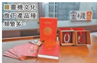
靈機文化旗下產品種類繁多。

創業初期，公司只有6個年輕人，大家對於風水命理也只是有所聽聞不知其詳，二人便從自己做起，閱讀相關書籍，邀請師傅定期來公司