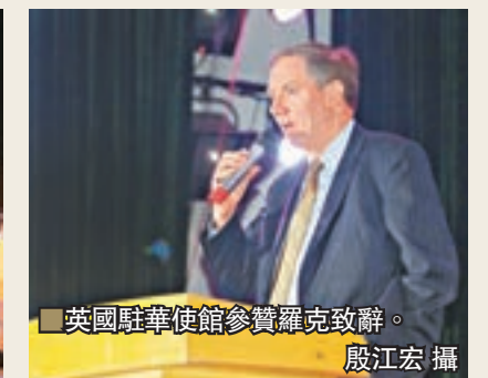
英國駐華使館參贊羅克致辭。