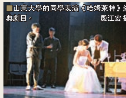
山東大學的同學表演《哈姆萊特》經典劇目。

據介紹，英國駐華使館於2016年啟動「永恆的莎士比亞」活動，以紀念莎士比亞逝世400周年。一年間，使館在中國多地組織了一系列大型活動，通過分享莎翁的作品，激發並促進文化、教育和經濟領域的交流。在活動的最後階段，將有一系列超過十六場風格獨特的工作坊和座談會在北京、西安、濟南、天津、合肥、南京、武漢、廣州與上海舉行。英國業界頂尖專家將來到中國參與活動，通過莎士比亞著作與參與者互動，跨越文化與年齡的界限。