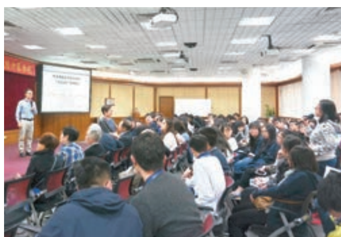
■張光南教授為學生講解粵港澳合作中存在的一些優勢和阻礙。