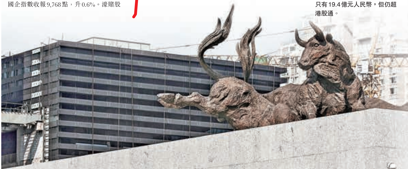
■深港通第二日淨流入減少至只有19.4億元人民幣，但仍超港股通。