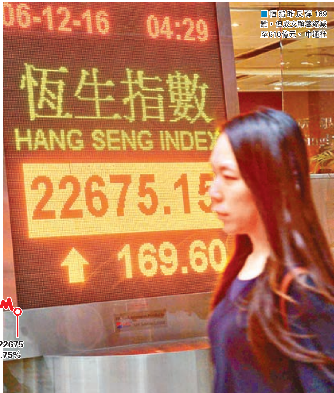
■恒指昨反彈169點，但成交顯著縮減至610億元。