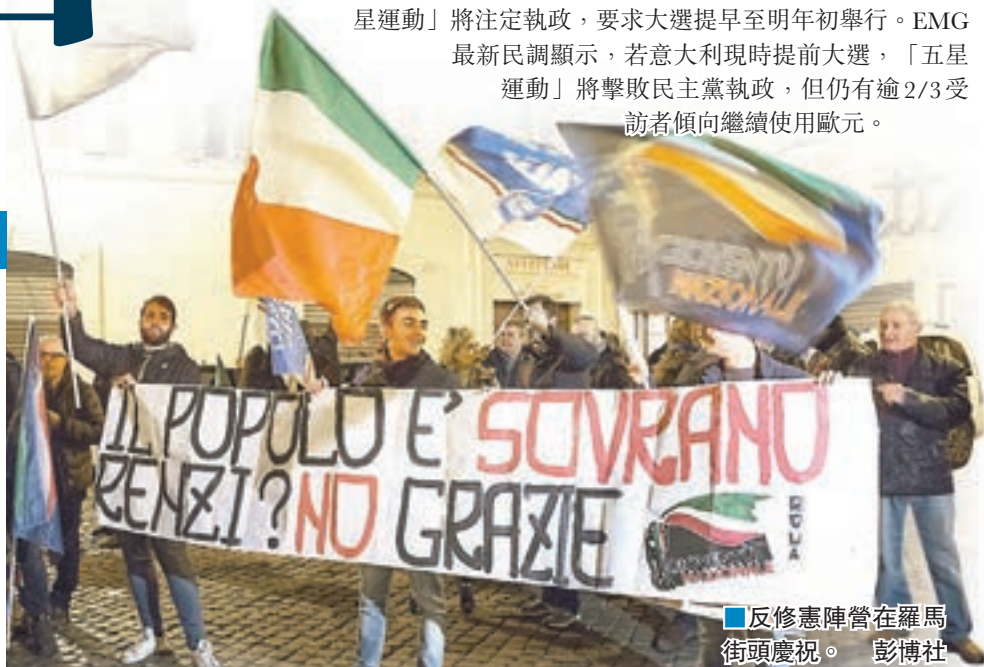
■反修憲陣營在羅馬街頭慶祝。

意大利原定最遲後年春天舉行大選，格里洛揚言倫齊下台後，「五星運動」將注定執政，要求大選提早至明年初舉行。EMG最新民調顯示，若意大利現時提前大選，「五星運動」將擊敗民主黨執政，但仍有逾2/3受訪者傾向繼續使用歐元。