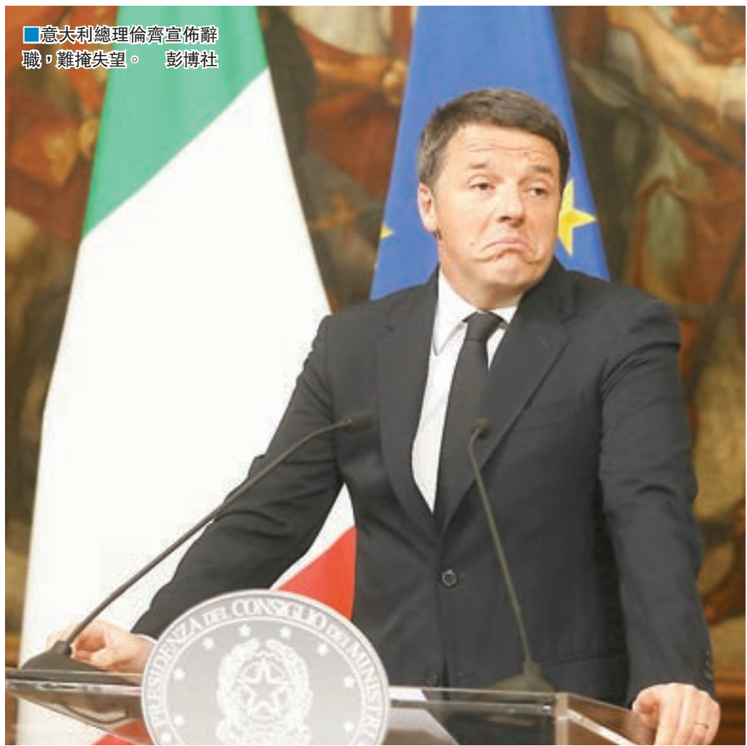
■意大利總理倫齊宣佈辭職，難掩失望。

除了反建制的「五星運動」，就連倫齊黨友、前總理達萊馬亦加入反對憲制改革陣營，甚至作人身攻擊，批評倫齊為沉溺於「蠢材」。總統馬塔雷拉亦從不認為倫齊需把政治前途押上，因這場公投是關於改革，而非關於政府表現，但在民怨極深的情況下，倫齊誤把公投變為針對他個人的信任投票，令選民得到一個發洩怨氣的機會。