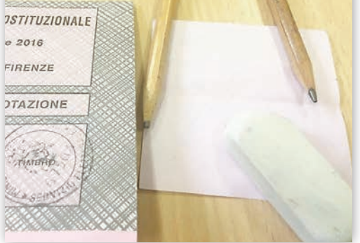
■選民在選票上用橡皮擦去筆跡。

反對修憲的歌手Piero Pelù前日於社交網站facebook上載照片，顯示他嘗試以橡皮擦去選票上的筆跡，結果紙上只留下些微痕跡。他表示已向票站主任反映問題，並鼓勵支持者投票。