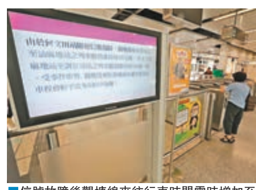
信號故障後觀塘綫來往行車時間需時增加至10分鐘。

全長2.6公里的觀塘綫,由觀塘綫油麻地站延伸至新建的何文田站及黃埔站,於今年10月23日正式通車,其中何文田站依山而建,車站共分8層,日後是觀塘綫及沙中綫東西走廊的轉車站,是全港最大港鐵轉乘站。不過何文田站