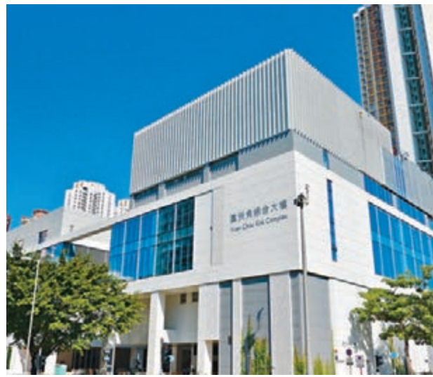
圖示體育館內14米高的戶外運動攀牆。圓洲角體育館於12月12日啓用，是康樂及文化事務署在沙田區的第六個體育館。

香港文匯報訊(記者 聶曉輝) 康文署在沙田區的第六個室內體育館、位於圓洲角綜合大樓低座的圓洲角體育館於下周一一起投入服務。新體育館建有區內首個室內草地滾球場，提供4條球道，讓市民可全天候進行草地滾球活動。