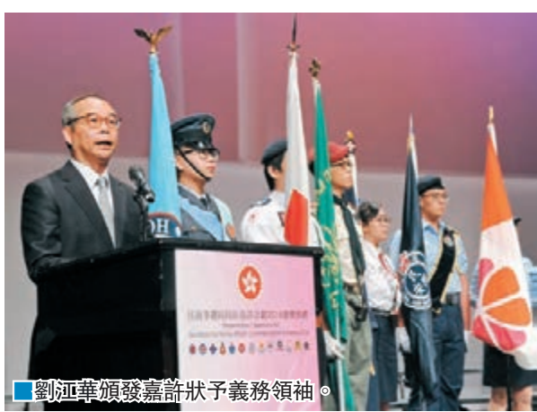
劉江華頒發嘉許狀予義務領袖。

香港文匯報訊(記者 聶曉輝) 民政事務局長劉江華日前在「民政事務局長嘉許計劃2016」上，頒發嘉許狀及獎章予青少年制服團體的36名義務領袖及20名青年義務領袖，表揚他們在青少年培訓及發展工作的貢獻，並向他們致以由衷的謝意。他讚揚各義務領袖一盡心盡力，無私付出，培育了無數的青年團員，讓他們得以傳承各個制服團體的優良傳統，成為有擔當、有熱誠的青年。