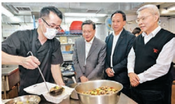
張炳良(左二)到訪樂「膳」堂營養膳食服務中心，了解中心的運作和提供的服務。

香港文匯報訊(記者 聶曉輝) 運輸及房屋局局長張炳良日前到訪九龍城區，了解區內的社會服務和護理安老設施，並與九龍城區區議員會面。他在九龍城民政事務專員郭偉勳陪同下，首先參觀東華三院黃祖榮社會服務大樓，聽取工作人員介紹該處一間職業復康中心的服務和工場的運作。他亦到訪大樓內護理安老院和長者地區中心，了解當區長者的生活情況。