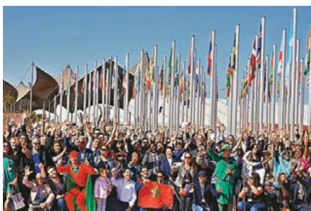
■ 馬拉喀什氣候大會與會者在會場外拍照。 資料圖片

這個消息代表國家有可能只靠可再生能源運作，為可再生能源的投資與使用注入強心針，不過也需要注意，葡萄牙的能源公司在2014年錄得53億美元的赤字，政府對於可再生能源的補貼也造成財政負擔，甚至至今今天仍存在赤字，因此不能太過樂觀，認為所有地區都可以如此仿效。