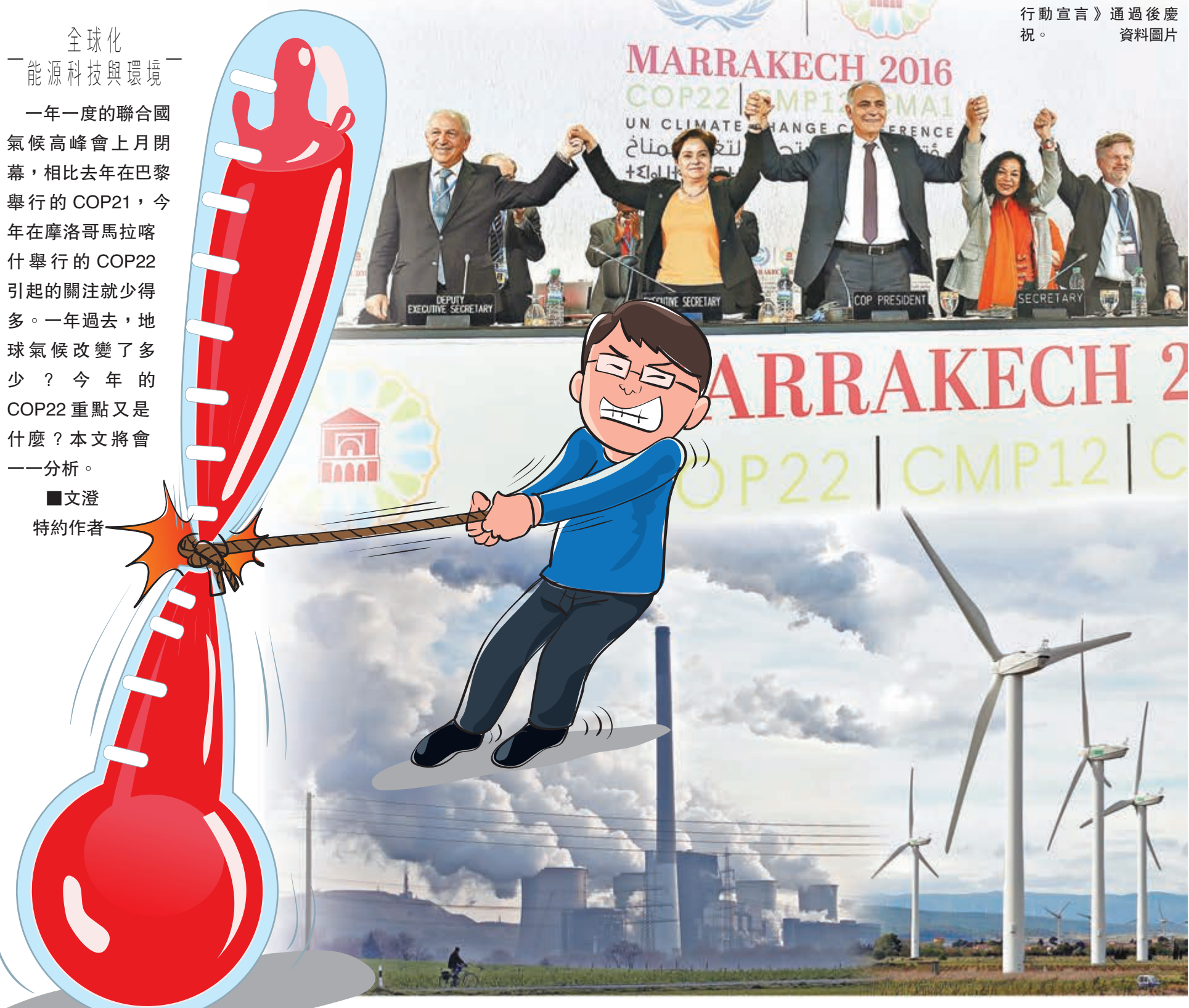
■ 各代表在《馬拉喀什行動宣言》通過後慶祝。