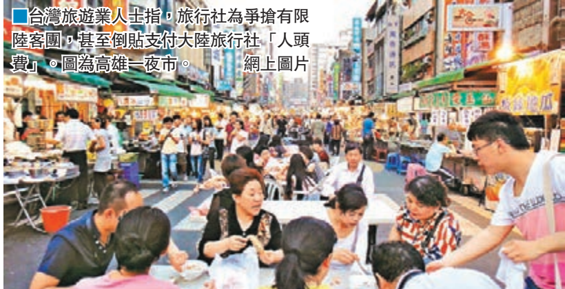
台灣旅遊業人士指，旅行社為爭搶有限陸客團，甚至倒貼支付大陸旅行社「人頭費」。圖為高雄一夜市。

情商及經驗較差的導遊，難免擺張臭臉給陸客，有時甚至口出惡言，這也是最近時有導遊與陸客發生紛爭的主因。老經驗的導遊各有應變技巧，一名導遊表示，愈不消費的陸客他愈客氣，讓對方覺得不買不好意思。有旅行業者認為，近幾年陸客未必把台灣當成第一選擇，而目前赴台的陸客團口袋深度有限，倒貼人頭費搶客迫購物的做法，只會砸了招牌。