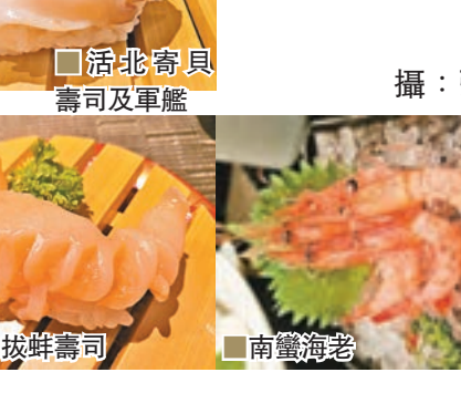
極上鮮捕鮮嚼海之幸 (4-6人用) (HK$480)。燒鱈場蟹。活帆立貝壽司及軍艦。活北寄貝壽司及軍艦。活象拔蚌壽司。南蠻海老。

一向以來，日本食品都特別吸引香港食客，尤其是來自日本本地的食材，因此千兩每季都舉行不同的海鮮祭，如今個冬季它就舉行了北海道冬季海鮮祭，特地引入鱈場蟹；而最近香港更開設了由日本直送來港的海產專門店，實行一條龍服務，於其專門店提供餐膳，令港人品嚐到更新鮮的海產料理，不用再飛到日本才能吃得到，吸引不少港人到訪，回味無窮。 文：吳綺雯