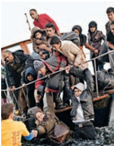
■難民船無法保證難民安全，許多難民在乘船時喪生。資料圖片

亞洲方面，去年緬甸海軍曾在羅興亞人聚居的若開邦孟都對開海域截獲偷渡船，其中一艘由泰國人擁有，載有219人，包括208名難民、9名船員及2名翻譯。緬甸政府指，船員及難民其後會被遣返，但有當地志願團體表示，部分難民是原居於孟都的羅興亞人，而非孟加拉人。美國副國務卿布林肯曾在事前到訪緬甸首都內比都，跟緬甸政府討論難民危機；後者在事後指難民事件屬人口販賣，並非如美方所指的涉及政治或宗教歧視。