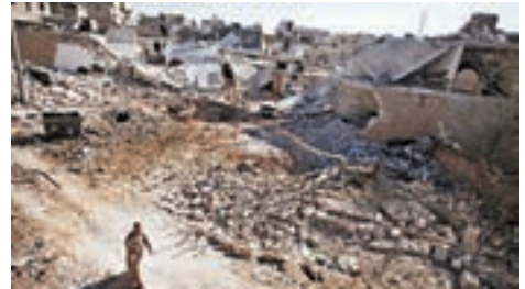
■敘利亞內戰，到處是頹垣敗瓦。

中東及非洲多國近年除了貧窮，還有2011年「阿拉伯之春」後，區內持續不斷的戰火所致。敘利亞內戰延綿多年，政府軍和多個反對派武裝在全國多處戰鬥，北部更由極端組織「伊斯蘭國」(ISIS)控制。不少居民耗盡僅餘積蓄逃離家園，尋求安全地方容身。