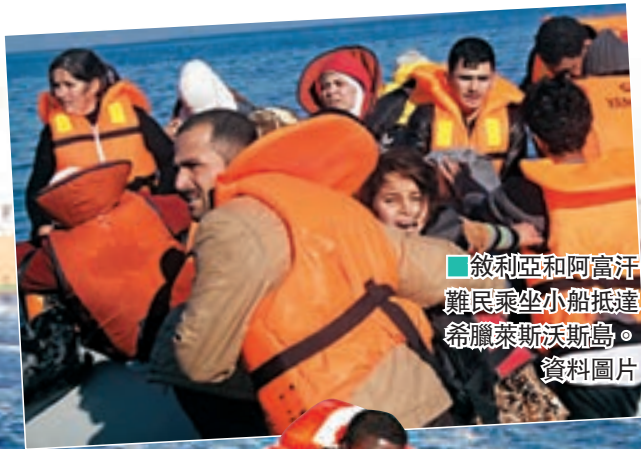
■敘利亞和阿富汗難民乘坐小船抵達希臘萊斯沃斯島。資料圖片