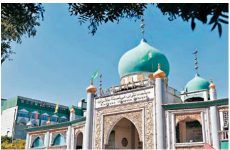
■羅興亞穆斯林遭迫害多年。資料圖片

羅興亞人信奉伊斯蘭教，緬甸獨立後不承認羅興亞人，認為他們只是殖民地時期的移民，屬於非法居留，要求把他們遣返孟加拉，並處處限制其權利。羅興亞人往往淪為苦工，沒有土地擁有權。