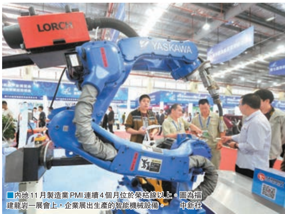
■內地11月製造業PMI連續4個月位於榮枯線以上。圖為福建龍岩一展會上，企業展出生產的智能機械設備。

香港文匯報訊（記者 海巖 北京報道）國家統計局昨日發佈數據顯示，11月中國製造業採購經理指數（製造業PMI）和非製造業商務活動指數（服務業PMI）雙雙錄得2014年7月以來高點。當月製造業PMI上升0.5個百分點至51.7%，連續4個月位於榮枯線以上；非製造業商務活動指數升至54.7%，為連續第三個月上升。專家表示，當前經濟企穩回暖信號明確，預計全年增長將保持6.7%，但內生動力仍較弱，明年經濟可能更困難。