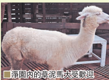
淨園內的草泥馬大受歡迎