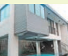
福灣的別墅，設計高貴而不失大方。

品嚐滋味的海鮮大餐後，是時候回房休息了，而福灣的別墅，又帶給客人另一番體驗。置身在福灣的別墅，又是另一番享受。每棟別墅均有獨特的空間形式，房間用色柔和，設計高檔優雅，配合運用多種原生樹種植栽結合的庭園設計，讓你遠離都市煩囂。房間內的設備先進，日用品均一應俱全。