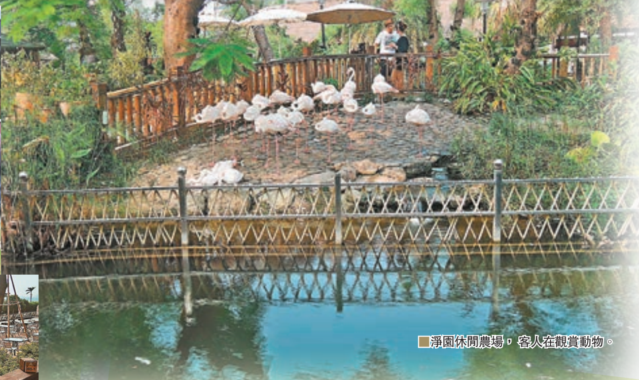
淨園休閒農場，客人在觀賞動物。