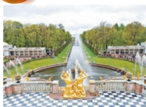
俄羅斯彼得夏宮花園噴泉「皇者氣派」