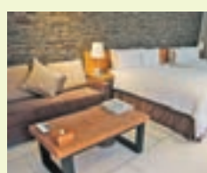
別墅房間環境優美，設備齊全。