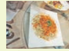
東港特產櫻花蝦炒飯