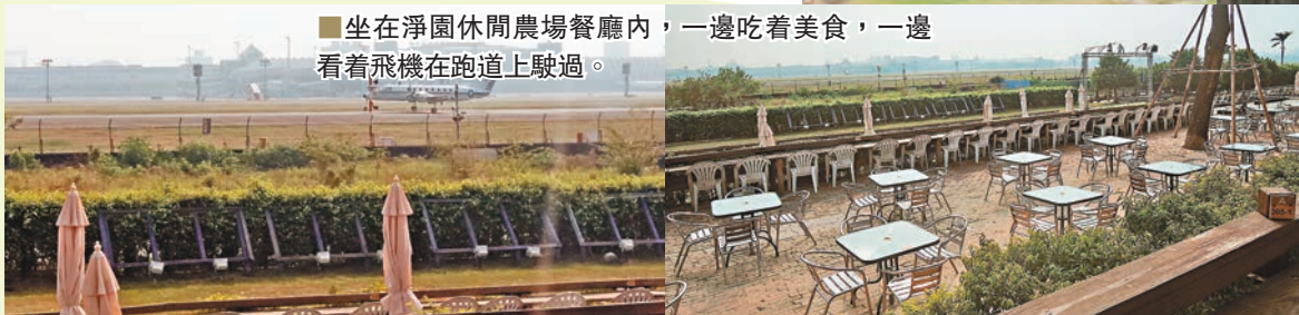
坐在淨園休閒農場餐廳內，一邊吃着美食，一邊看着飛機在跑道上駛過。