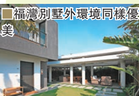
福灣別墅外環境同樣優美