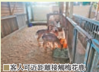
客人可近距離接觸梅花鹿