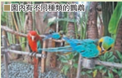
園內有不同種類的鸚鵡