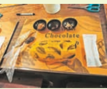
客人可親自製作巧克力