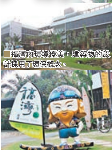
福灣莊園休閒農場