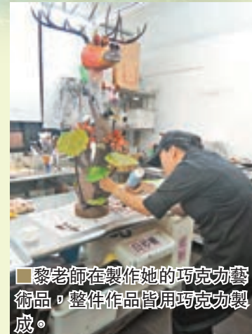
黎老師在製作她的巧克力藝術品，整件作品皆用巧克力製成。