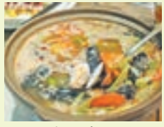
福灣美食，花甲龍王湯加入中式辛香料與大量花甲，味道層次豐富。