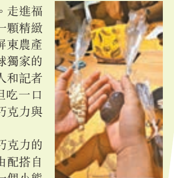
客人可在福灣莊園巧克力坊親手製作巧克力