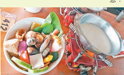
淨園餐廳還提供新鮮海鮮火鍋

餵完小動物後，如果還不足，還可以觀賞「肯亞三兄弟」的特別演出。來自東非肯亞國度的肯亞三兄弟在2016年受邀來到淨園農場作駐園演出，熱情好客的三兄弟以其獨特的舞蹈及高難度的特技表演迎接一眾來賓，幸運的觀眾還有機會受邀與他們同台演出嘍！肯亞三兄弟逢星期一、二、四、五、六、日均有演出，有興趣的觀眾記住留意！