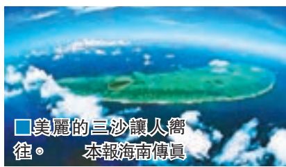
美麗的三沙讓人嚮往。

香港文匯報訊(記者 何汝 海南報道)海南三亞今年接待郵輪遊客量有望達到11萬人次,「南海之夢」號郵輪即將運營三沙航線,明年有望有5艘郵輪以三亞鳳凰島為母港,經營環島遊、西沙遊航線。