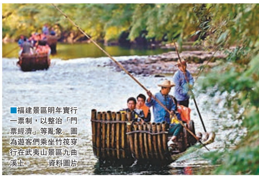
福建景區明年實行一票制,以整治「門票經濟」等亂象。圖為遊客們乘坐竹筏穿行在武夷山景區九曲溪上。資料圖片

香港文匯報訊(記者 蘇榕蓉 福州報道)福建省日前出台的《福建省景區門票及相關服務價格管理辦法》(簡稱《辦法》)明確規定,自明年1月1日起,福建景區門票實行一票制。此《辦法》一經推出,立刻引起社會熱議,並被業界專家解讀為「福建推進旅遊景區整頓治理,謀求轉型升級、提質增效,着力將「門票經濟」轉變成旅遊產業經濟的有力舉措」。