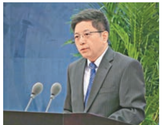
馬曉光昨日指出，李登輝之流指的路只能是懸崖斷壁。

上海國際問題研究所副所長胡洪波提醒，針對民進黨執政後台灣發展戰略出現的根本性變化，為了保持亞太地區的和平與穩定，要防止台灣問題綁架中美關係，防止因民進黨執政後台灣發展戰略的改變導致亞太地區的戰略平衡被打破，引發中美關係、中日關係的對立與亞太地區的動盪。