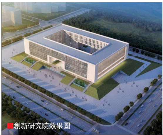
創新研究院效果圖

2016年11月26日，「北航—合肥科學城」項目在合肥新站高新區正式奠基，以此為標誌，北京航空航天大學與合肥市的校地合作跨入一個全新階段，而合肥新站高新區將開啓創新驅動發展的新引擎。