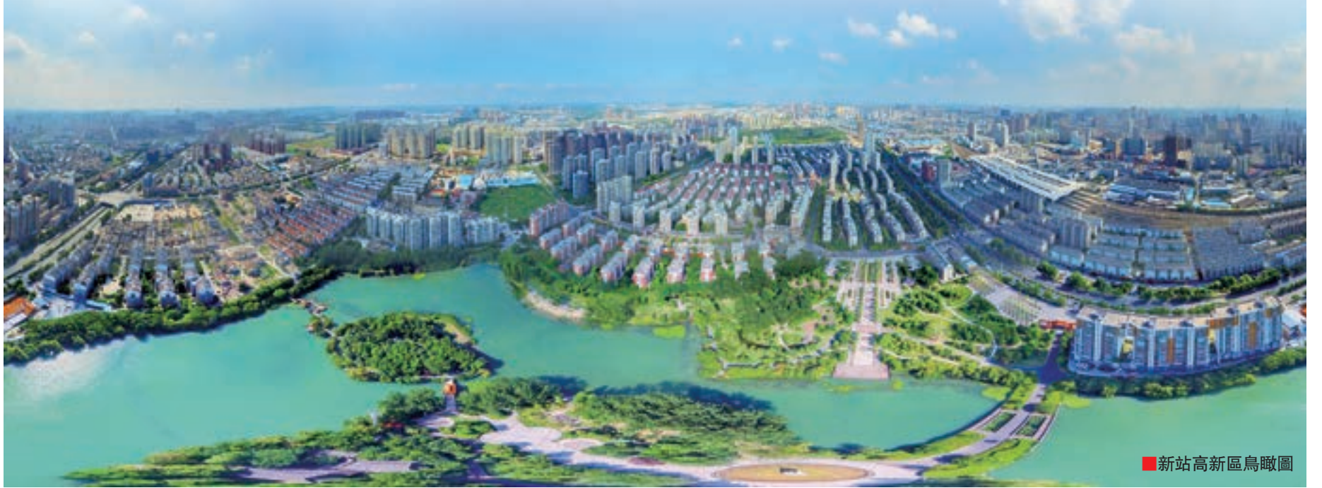
新站高新區鳥瞰圖

今年7月25日，安徽省與北航簽署了全面戰略合作協議，合肥市政府與北航簽署「北航—合肥科學城」項目戰略合作協議，在合肥新站高新區規劃建設北航合肥科學城，重點打造科研創新、成果轉化、高端教育、國際交流板等4大板塊平台，融合基礎前沿研究、核心技術攻關、高新成果轉化、創新人才培養、國際交流合作、和諧宜居生活6大功能體系，佈局量子傳感、微電子、航空大數據（低空空域管理）、通用航空、智能交通等一批重點方向，培育發展戰略性新興產業，努力打造成一個滿足國家戰略需求和區域經濟社會發展需要具有國際競爭力的頂級開放型、創新型、生態型的科學城。