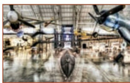
航空航天公園效果圖

高品質實現校地合作。作為全國首個科技創新型試點城市，合肥以科技創新為支撐，持續加大教育、科技、協同創新平台等方面的佈局與投入，創新活力不斷釋放，創新驅動力漸顯。合肥新站高新區在發展中不斷深化與高校、科研院所的合作，謀劃建設一批重大創新平台。北航合肥科學城建成後，將進一步推進科技與產業深度融合，有利於戰略性新興產業的培育、高新技術企業的孵化、前沿科技成果的轉化，從而推動產業結構不斷轉型升級、助力區域經濟跨越式發展，實現高品質的校地合作典範。