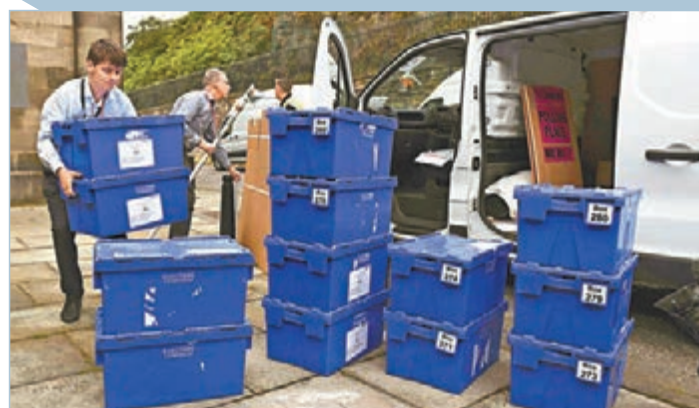
歐洲各地公投的投票率中位數下降。資料圖片