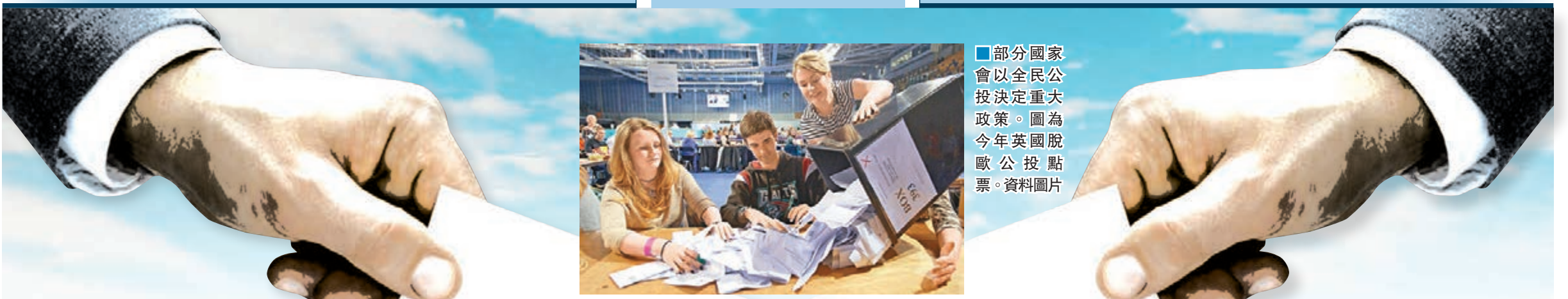
部分國家會以全民公投決定重大政策。圖為今年英國脫歐公投點票。

今年多個國家都舉行公投決定重要政策和路向，其中英國6月公投通過脫離歐盟，全球風雲變色。「公投潮」將具爭議的政策，交由全體選民一人一票決定。這種「直接民主」方式是一把雙刃劍，雖然表面上體現了公民參與的民主制度，但弊端也不容忽視，例如公眾可能遭誤導、或未能獲得充分資訊，作出輕率選擇。學者指出，發起公投的先決條件是要有十足勝算，否則稍有差池，結果與預期相反，個別政治人物以至整個國家或社會都會承受沉重代價。