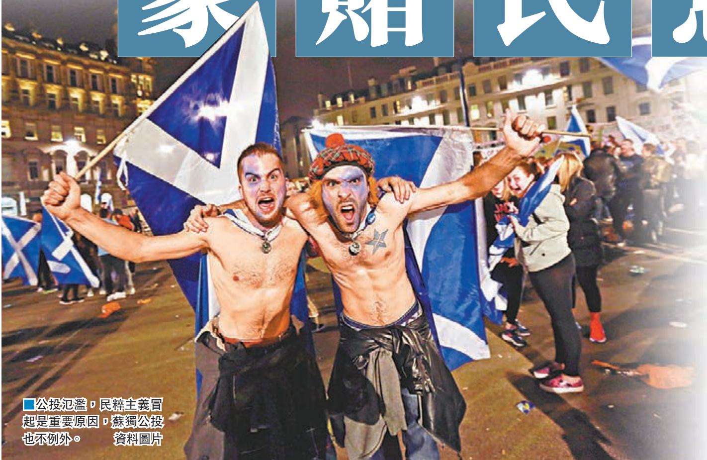
公投氾濫，民粹主義冒起是重要原因，蘇獨公投也不例外。資料圖片