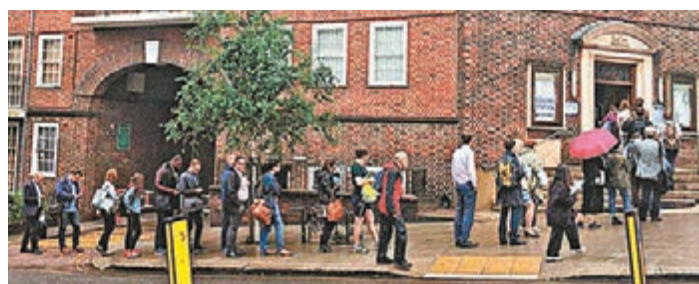
有政客認為公投能鼓勵公民在政治上參與更多。資料圖片