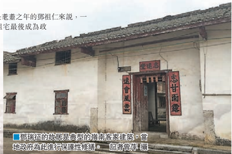
■鄧瑞征的故居是典型的嶺南客家建築，當地政府為此進行保護性修繕。