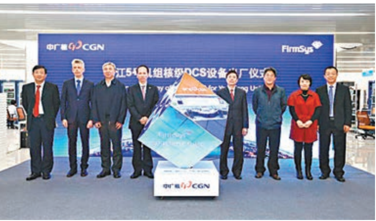
中國首套自主研發的核電DCS設備即將交付陽江核電站。

香港文匯報訊(記者 何花 深圳報導)中廣核集團透露,陽江核電站5號機組核級數字化儀控系統(DCS)設備將正式出廠,這也是中國首套自主研發的核級核電站數字化儀控系統(簡稱「DCS」)和陸系統即將正式交付給使用方陽江核電站。中國核電站首次裝上了國產的「中樞神經」系統。