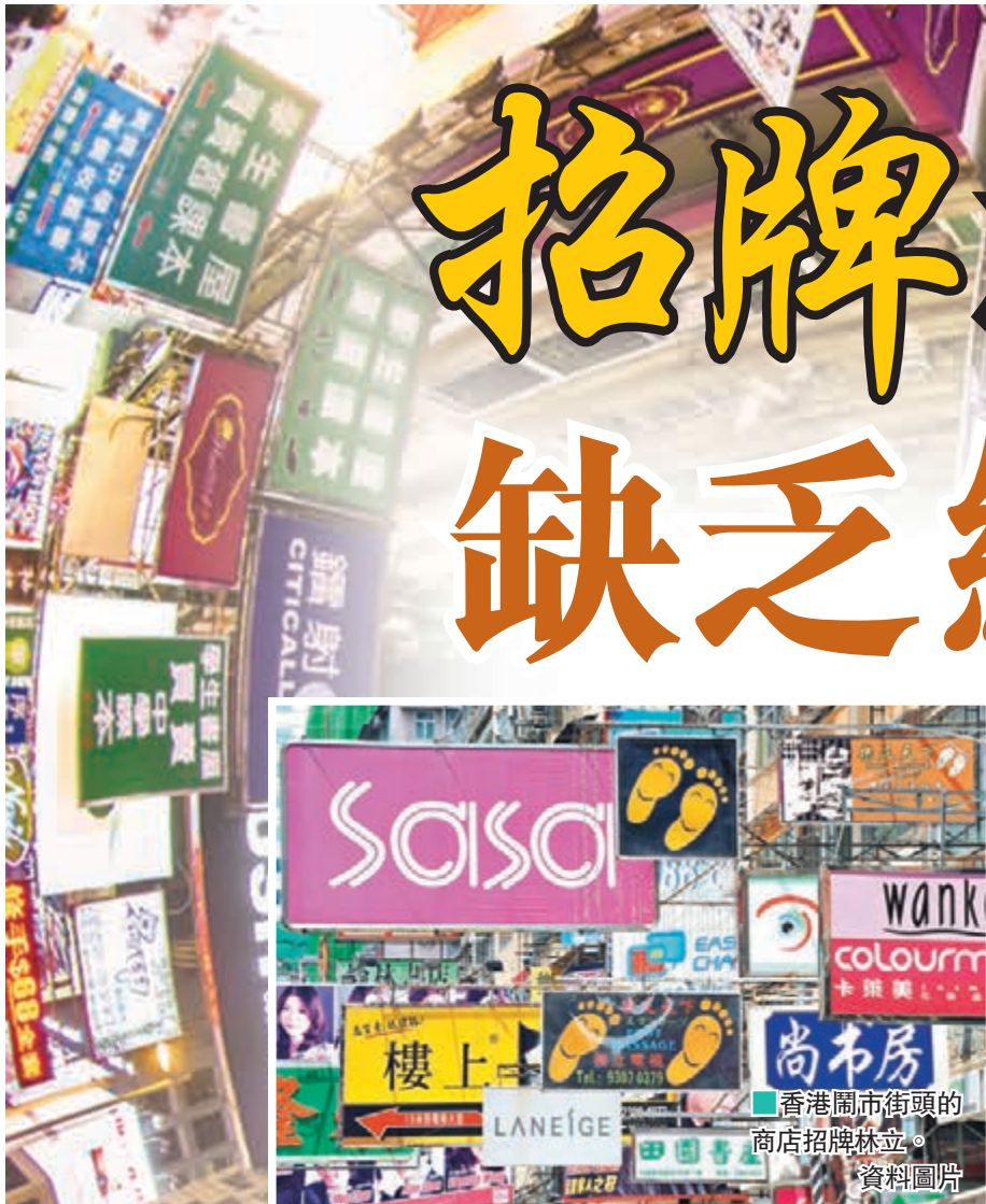
香港鬧市街頭的商店招牌林立。