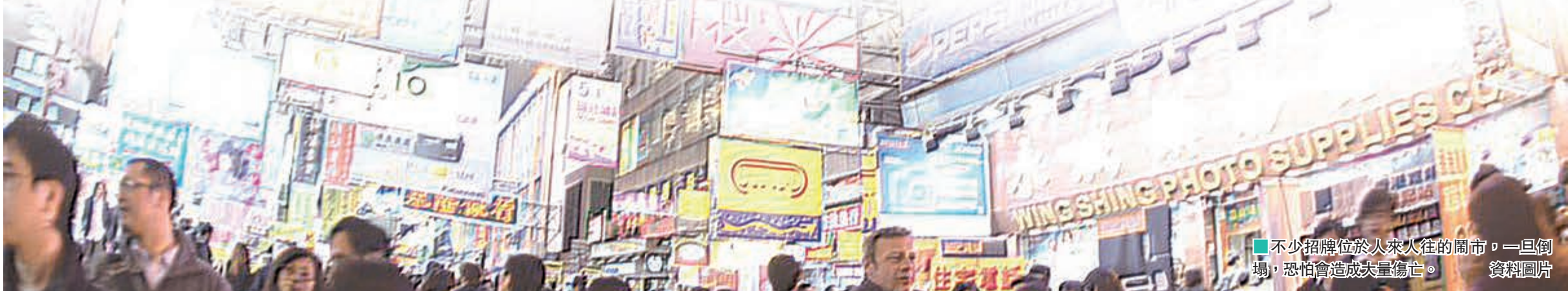
不少招牌位於人來人往的鬧市，一旦倒塌，恐怕會造成大量傷亡。資料圖片

刑事訴訟是指對整個社會利益及安全造成影響而提出的訴訟。假如商戶不履行清拆令，意即可能對市民造成安全影響，屋宇署便會提出刑事訴訟。然而，一般市民如因招牌掉下受傷，因只涉及個人經濟利益追討，則需要由當事人向招牌擁有人提出民事索償。