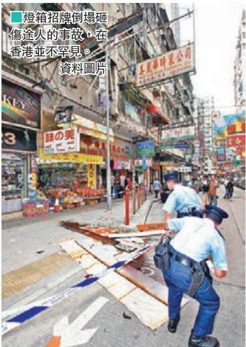
燈箱招牌倒塌砸傷途人的事故，在香港並不罕見。資料圖片

6月已檢核或拆除近200個違規招牌。除了監管及執法，屋宇署並透過印刷單張及小冊子加強宣傳，試圖改變違規風氣。儘管政府大力打擊違規招牌，違規情況仍然禁之不絕。