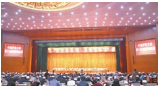
中國伊斯蘭教第十次全國代表會現場。