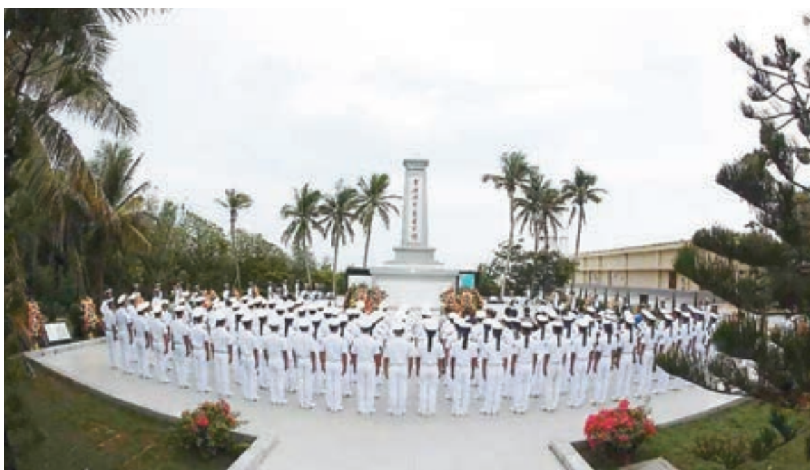
海軍高級首腦祭奠西沙海戰英烈。

香港文匯報訊 綜合本報記者何玫及《環球時報》報道，11月25日晚間中央電視台的軍事報道欄目播出海軍司令吳勝利赴琛航島西沙海戰烈士陵園祭奠西沙海戰烈士。這是迄今為止官方首次公開的海軍司令祭奠西沙海戰英烈的報道。軍事專家認為，中國海軍的高級首腦通過此次活動表明維護南海主權決心；同時也給周邊國家一些警示，不要輕舉妄動，即使在當年敵強我弱的情況下，中國海軍還是打贏了侵略者，現今同樣不會懼怕。