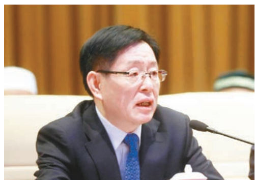
王作安在會議上發言。

香港文匯報訊 據中新社報道，中國伊斯蘭教第十次全國代表會議昨日在北京開幕。國家宗教事務局局長王作安應邀出席會議並發表講話。