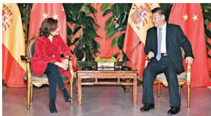
■習近平在西班牙大加那利島會見西班牙副首相薩恩斯。

伊首相的親切問候，贊同習近平對兩國關係的評價。薩恩斯表示，西班牙珍視同中國的傳統友誼，願同中方密切高層交往，深化經貿、金融、科技、旅遊領域務實合作，密切人文交流，加強在國際事務中的協調配合。西班牙願繼續成為促進歐中關係發展的橋樑。 習近平是在結束對智利國事訪問回國途中在西班牙大加那利島作技術經停。 當地時間23日上午，習近平離開智利。離開時，智利政府高級官員到機場為習近平和夫人彭麗媛送行。