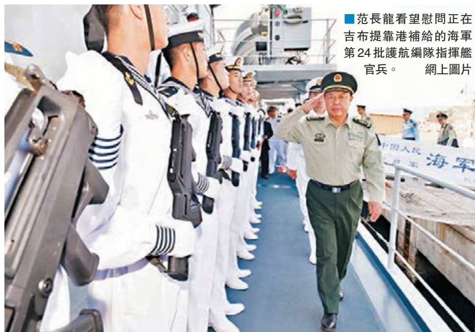
■范長龍看望慰問正在吉布提靠港補給的海軍第24批護航編隊指揮艦官兵。網上圖片

香港文匯報訊（記者 葛沖 北京報道）中國首個海外後勤保障設施建設正在加速。國防部網站昨日發佈的消息顯示，中央軍委副主席范長龍在出訪期間，看望慰問了在執行吉布提保障設施建設任務的部隊官兵。看望中，范長龍要求，海外保障設施建設要加強統籌協調，加快建設進度，確保建設質量，為軍事力量遂行海外任務提供有力支撐。據了解，該設施建成後，將主要用於中國軍隊執行亞丁灣和索馬里海域護航、維和、人道主義救援等任務的休整補給保障。