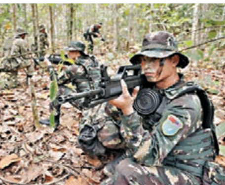
■參加中馬聯合軍演的人員在進行野外追蹤演練。

略戰役指揮人員的專業能力、實兵部隊的精湛技能、參演官兵的優良作風和雙方軍事人員的文化素養。 法茲爾表示，此次聯演不僅增進了兩國全面戰略夥伴關係，還加強了兩軍關係，提升了雙方聯合行動的能力，增進理解互信。 「和平友誼-2016」中馬聯合軍事演習於11月22日至25日在馬來西亞巴耶英達附近地域舉行，分參謀部演練和實兵演練兩部分。雙方總兵力約300人，其中中方195人，主要來自軍委機關、南部戰區機關和駐香港部隊。