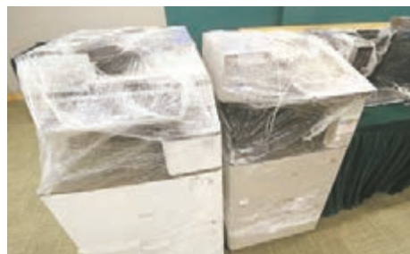
■行動中檢獲的其中兩台影印機。