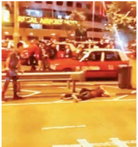
■俄籍劫匪(右)乖乖趴在地上就擒。