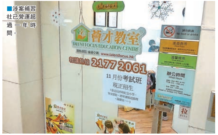
■涉案補習社已營運超過一年時間。

懷疑侵權的補習社名為「菁才教室」,總校位於將軍澳坑口新寶城商場1樓。據海關透露,涉案補習社以連鎖特許經營方式運作,主腦本人負責打理兼作辦公室的總社,其他分社東主需先繳付10多萬至20萬元的加盟費,主腦則負責向分社提供所需課程教材,而分社東主須每月再按各自盈利,向主腦繳付若干比例的金錢。惟補習社使用的課程教材,全部涉嫌侵權,有人認為營運者觸犯版權條例,遂予以舉報。