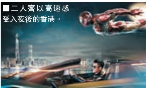
二人齊以高速感受入夜後的香港。

作為東道主，Aaron更穿上唐裝，帶同Iron Man到酒樓飲茶，Aaron笑言因為Iron Man是「鐵甲奇俠」，所以就親自沖製「鐵觀音」給對方品嚐，但想不到Iron Man也甚懂中國飲茶文化，當Aaron向他送上鐵觀音時，Iron Man以手指敲枱，表示謝意，令Aaron也感到很驚訝。二人最後更拍下Selfie，以紀念這次見面。