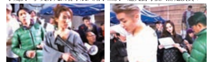
梁朝偉與吳亦凡玩「假人挑戰」的現場照片。

吳亦凡上載影片的同時，也點名了范冰冰、李晨、黃曉明、Angelababy等接受挑戰。李晨看了影片不禁問道：「請問，你們是練了幾次？」吳亦凡回答李晨只用了三次，還笑虧每個人都是演員！