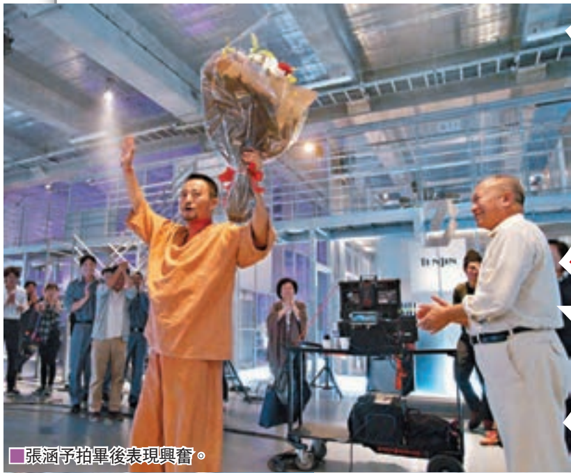
張涵予拍畢後表現興奮。