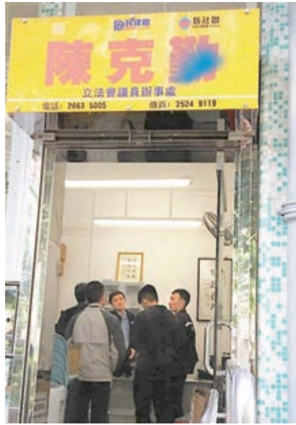
辦事處招牌中的「勤」字被噴上藍色油漆。

民航處已邀請傳媒今天到訪民航處總部，參觀航管系統及模擬器，屆時會更具體講解新航管系統的運作。