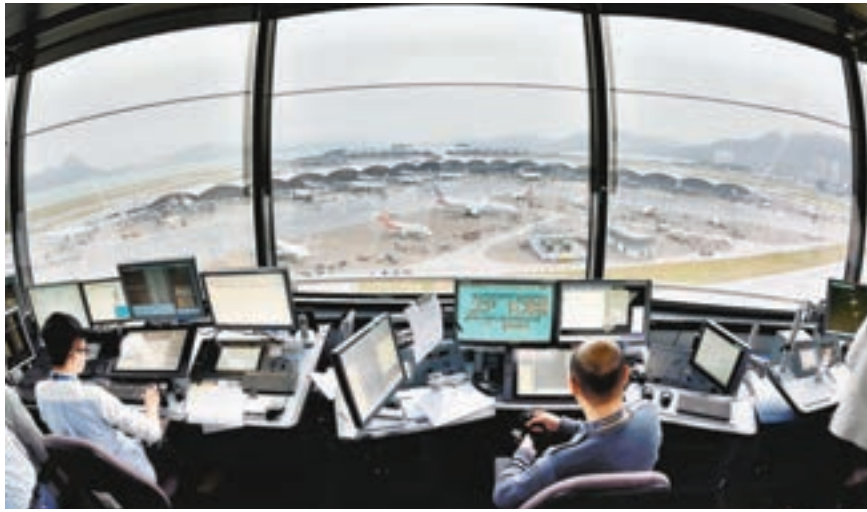
民航處強調雷達屏亂象只屬涉及不同外在因素的已預知情況。圖為航空交通管制人員在北空管指揮塔使用新系統處理實時交通。

他解釋，飛機在雷達屏幕上消失，就如上周報道的指航機在雷達中「消失12秒」；飛機出現「分身」則是同一架飛機，在屏幕上出現兩架並排而飛；「鬼機」是指有不明飛行物突然在雷達出現，又突然消失，令空管人