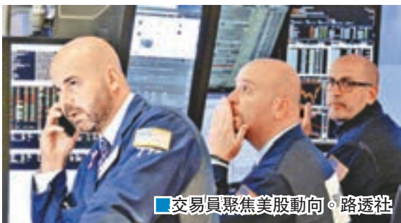
■交易員聚焦美股動向。

憧憬美國候任總統特朗普會推行減稅、增加基建投資及放寬監管等措施，美股自大選日以來長升長有，道指前日更史上首次升穿19,000點大關。不過有分析認為，假如聯儲局在下月會議上，暗示未來兩年加息步伐可能加快，或會令股市升勢受阻。