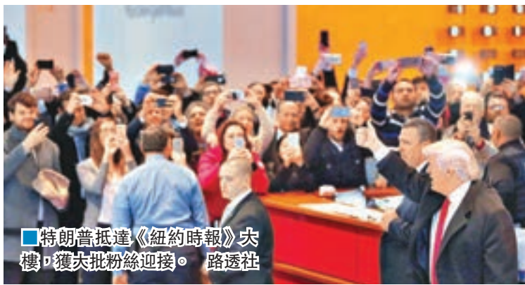
■特朗普抵達《紐約時報》大樓，獲大批粉絲迎接。