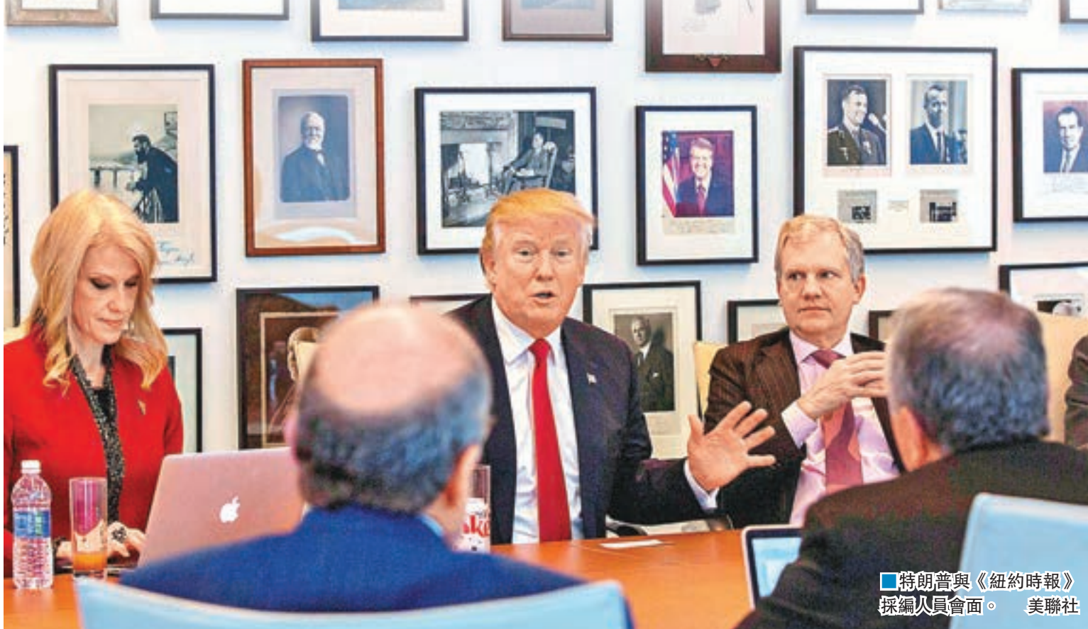
■特朗普與《紐約時報》採編人員會面。