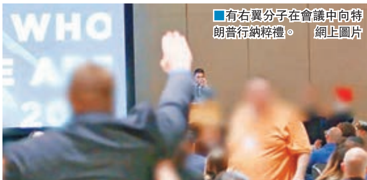
■有右翼分子在會議中向特朗普行納粹禮。