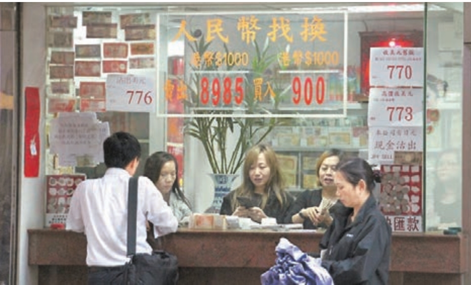
■儘管人民幣兌美元中間價終結束12連跌，但在香港兌換店，港元兌換人民幣則愈換愈多，昨已直叩9算。