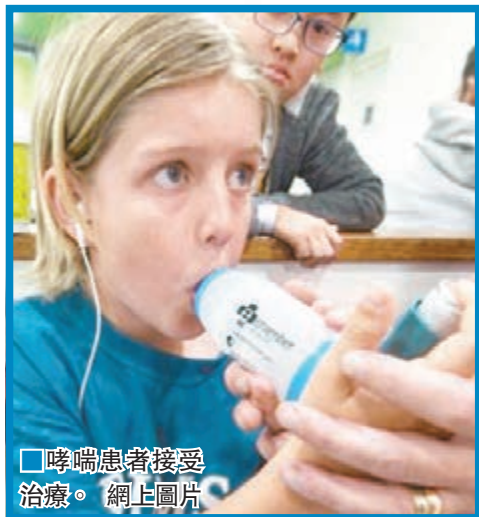
哮喘患者接受治療。網上圖片