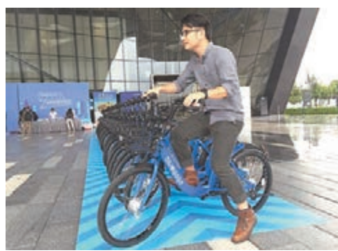
小藍單車定位於「輕運動」。

單車模式目前最大的特點是不用固定停車樁、不用辦卡。用戶通過使用手機下載app，完成註冊後，打開app便可定位出附近可供租用的單車即時位置；掃描車身上的二維碼即可解鎖單車；當用完車後，在路邊免費公共停車區域直接解鎖即可還車。註冊押金99元、299元(人民幣，下同)不等，每半小時收費在0.5元至1元之間。