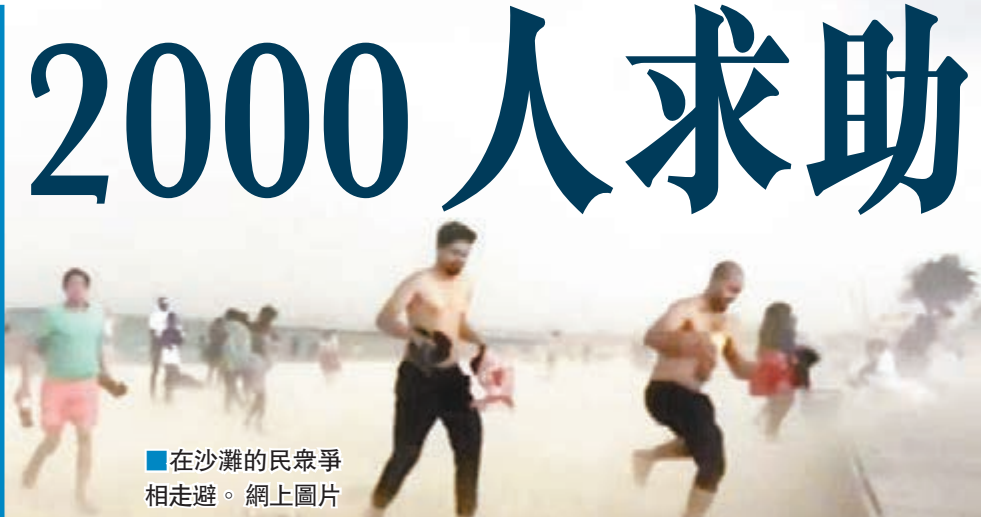
在沙灘的民眾爭相走避。

澳洲墨爾本前日遭遇一場罕見的「風暴性哮喘」，當晚一場雷暴捲起大量花粉和粉塵等過敏原，導致很多人出現呼吸問題等過敏症狀，霎時間前往診所求診的人數大增。報道指，在前日下午6時至晚上10時間，急救中心和醫院5小時內接到逾2,000次急救電話，是平時的7倍。事件導致2人喪生，數十人仍在深切治療部，死亡人數恐繼續上升。