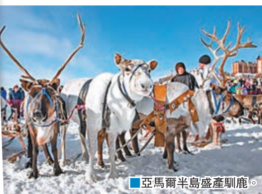
■亞馬爾半島盛產馴鹿。

氣候暖化問題日益嚴重，愈來愈多動物深受其害，從過往的北極熊獨坐融冰，到近年陸續出現瘦弱海鸚鵡被沖上阿拉斯