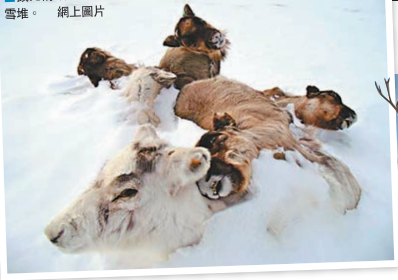
■餓死的馴鹿葬身雪堆。

氣候暖化問題日益嚴重，愈來愈多動物深受其害，從過往的北極熊獨坐融冰，到近年陸續出現瘦弱海鸚鵡被沖上阿拉斯