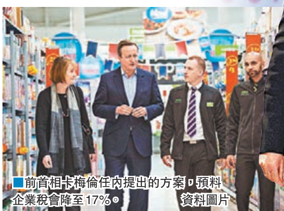
■前首相卡梅倫任內提出的方案，預料企業稅會降至17%。資料圖片

有評論指出，歐美降低企業稅一方面是為了吸引外資，但另一方面也是近年全球合力打擊企業跨境避稅的結果。包括美國及大多數歐洲國家在內的近百個國家，早前同意堵塞容許企業將利潤轉到避稅天堂的漏洞，意大利律師樓