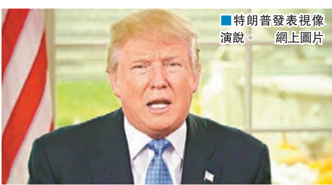
■特朗普發表視像演說。網上圖片

除了TPP外，特朗普的6項大計包括取消部分能源業限制、發展全面網絡安全計劃、調查工作簽證詐騙等。特朗普又表示上任