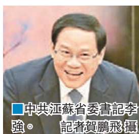
中共江蘇省委書記李強。

全局，以難題化解推進工作。要堅持深入基層、重心下移，主動到困難大、矛盾多的地方去解決問題，到任務最艱巨、群眾最需要的地方去推動工作，多做打基礎利長遠的實事，多做群眾得實惠的好事，努力創造實實在在的業績。為高水平全面建成小康社會、建設「強富美高」新江蘇而努力奮鬥。