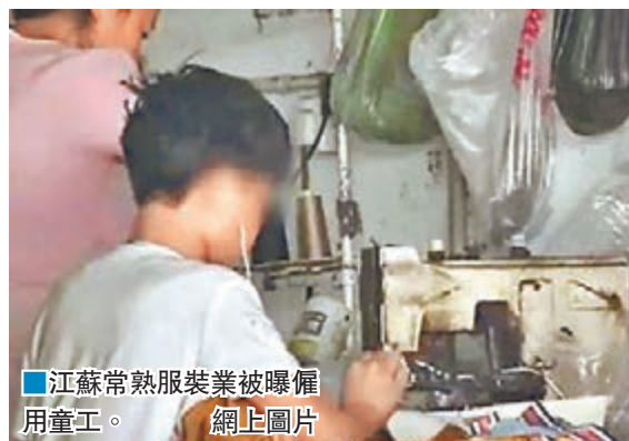
江蘇常熟服裝業被曝僱用童工。

報道指，這些童工們沒日沒夜地幹活，幾乎沒有休息日。不幹到年底，拿不到工資，中途逃跑還可能要賠償老闆的損失。一旦離開，老闆還會扣留他們的身分證、銀行卡、手機，甚至使用暴力。