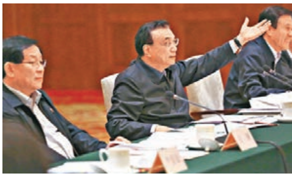
李克強在上海主持召開深化簡政放權放管結合優化服務改革座談會。

香港文匯報訊 據中國政府網報道，中共中央政治局常委、國務院總理李克強21日在上海主持召開深化簡政放權放管結合優化服務改革座談會，研究部署相關工作。