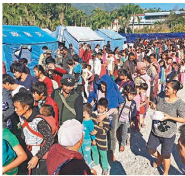
■安置點內的避戰邊民排隊領取早餐。

耿爽還表示，「中方已通過外交渠道向緬方提出交涉。我們強烈希望衝突雙方保持克制，立即停止有關軍事行動，避免局勢升級，採取切實有效措施盡快恢復邊境安寧，並防止出現損害中方主權和邊民生命財產安全的事情。中方也願意根據緬方意願，為推動緬國內和平進程發揮建設性作用。」