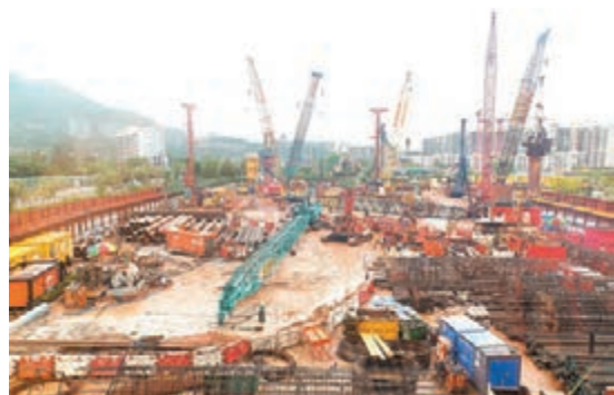
位於香港科學園第三期西面的香港科學園擴建項目鳥瞰圖。受訪者供圖