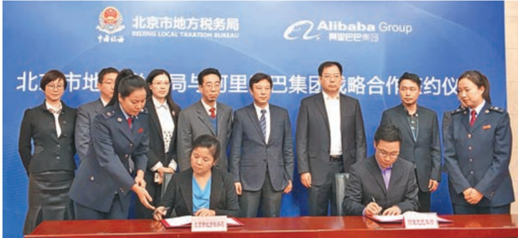
■ 阿里巴巴與北京地稅戰略合作簽約儀式現場。

香港文匯報訊（記者 張聰 北京報道）阿里巴巴集團與北京市地方稅務局昨簽訂戰略合作協議，雙方將基於阿里巴巴在城市服務、金融支付、信用等領域的能力，進一步打造智慧稅務，創新稅務管理服務模式，優化和提升服務納稅人的能力。北京市地稅局副局長王煒表示，此番與阿里巴巴合作，將加快推動「互聯網+稅務」服務領域的深度融合。