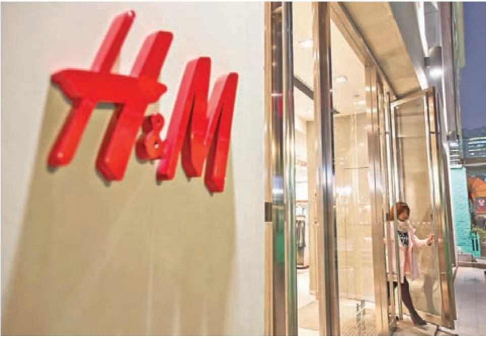
■ 服裝零售巨頭H&M稱看好中國內地市場，重裝升級上海全球旗艦店。圖為該公司於上海的分店。

目前，家樂福也不甘走下坡，正在積極摸索轉型，近期在上海開出內地首家24小時營業的家樂福超市。家樂福中國表示，想以此為試點並結合家樂福的網上商城，擬打通線上線下做O2O購物模式。目前來看，24小時營業家樂福顧客數量在不到一個月時間內增加了3倍，有望為門店貢獻5%至10%的銷售。