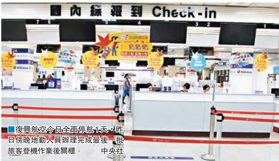
復興航空今日全面停航1天，昨日傍晚地勤人員辦理完成最後一批旅客登機作業後關櫃。

香港文匯報訊 綜合台灣媒體報道，台灣第三大航空公司復興航空無預警宣佈今日(22日)停航，令業界和旅客極度錯愕。復興表示在今日上午召開臨時董事會，下午2時對外說明後續停航及因應。公司方面報稱，受影響旅客人數為5,113人次。島內業界猜測是因為財務問題停航，其後會否繼續停航還需待股東會相關發佈。