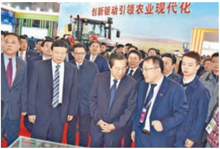
全國政协副主席齊續春(右三)、陝西省委書記婁勤儉(左二)巡視展館。

香港文匯報訊(記者李陽波 西安報導)被譽為「中國農業奧林匹克盛會」的第23屆中國楊凌農高會日前在陝西楊凌開幕，來自全球50多個國家的代表匯聚於此，通過展