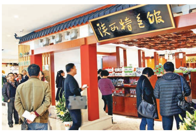
陝西名優特農產品入駐雲南聯展直銷平台。

香港文匯報訊(記者丁樹勇 昆明報導)南北名優特農產品雲南聯展直銷平台近日於昆明啟動運營，與陝西聯展直銷平台一道，為滇陝兩省農業企業、農業專業合作社、農特產品提供產銷對接、孵化服務。