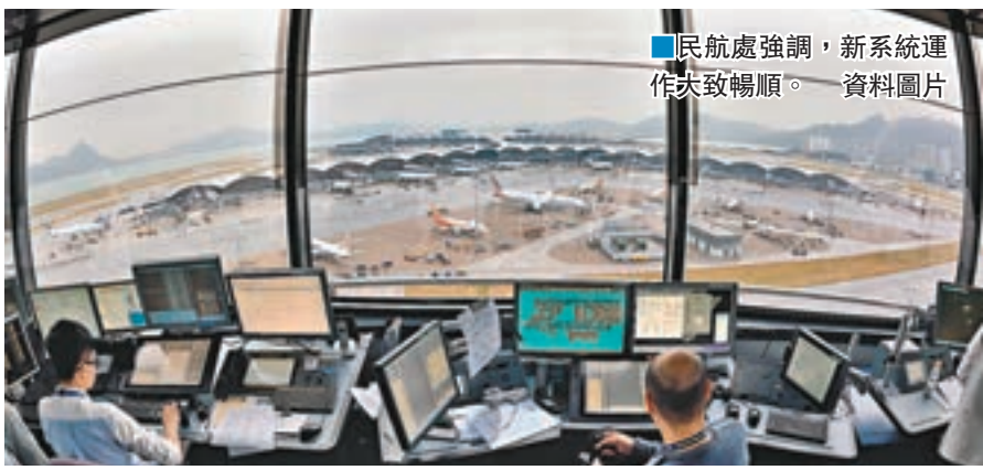
民航處強調，新系統運作大致暢順。

香港文匯報訊（記者 文森）新空管系統因漏洞太多押後4年，直至上周一（14日）才啓用，但有傳媒引述空管人員稱系統啓用一天後，曾有飛機起飛一分鐘後突然從雷達畫面消失約20秒至30秒才重新出現。民航處昨日證實，新空管中心一個雷達顯示屏幕，周二（15日）曾短暫未能顯示一班離境航機位置，以及短暫出現雙重影像，強調過程不多於12秒，否認報道所稱的20秒至30秒。民航處又表示，雷達螢幕短暫未能顯示個別航機位置情況，使用舊空管系統時亦有發生，強調新系統全面投入服務至今，整體運作大致暢順。