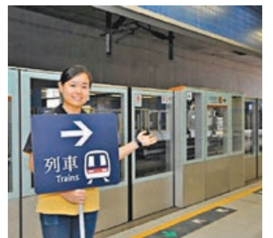
改動月台停車位置後，車站會加派手持指示牌的月台助理，協助乘客到指定位置上落車。

香港文匯報訊（記者 文森）面對日益增加的人口，港鐵增加列車數目提升容量。港鐵昨日公佈，港鐵馬鞍山線明年開始陸續由八卡列車取代四卡列車的沿線各車站延伸月台，今日起開放，所有馬鞍山線列車將停靠月台新位置，讓乘客上落。