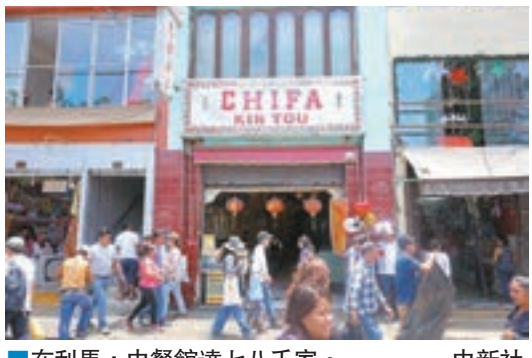
■在利馬，中餐館達七八千家。