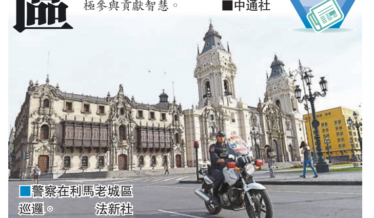
■警察在利馬老城區巡邏。