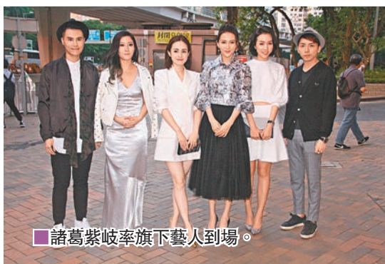
諸葛紫岐率旗下藝人到場。