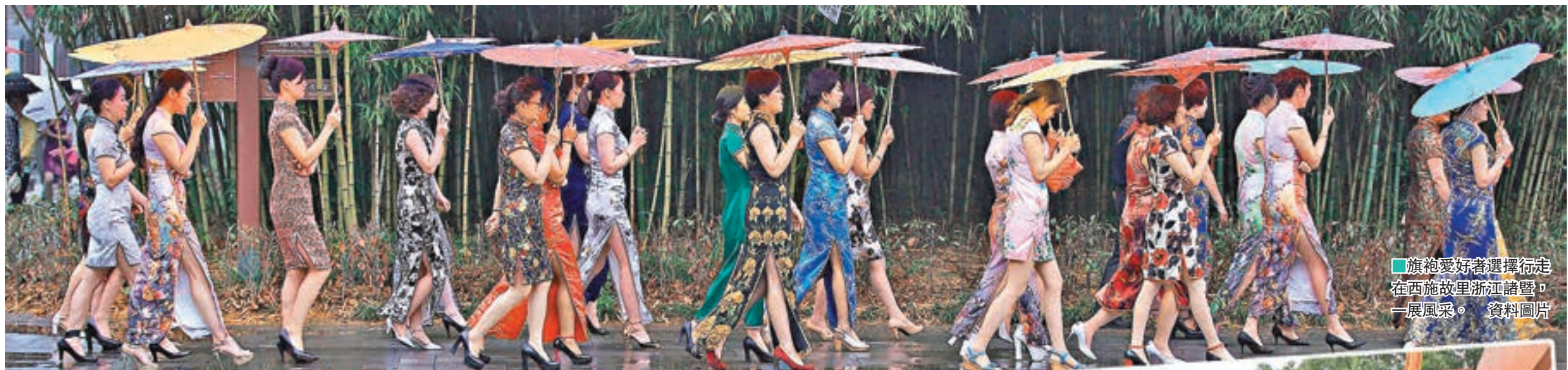
旗袍愛好者選擇行走 在西施故里浙江諸暨， 一展風采。