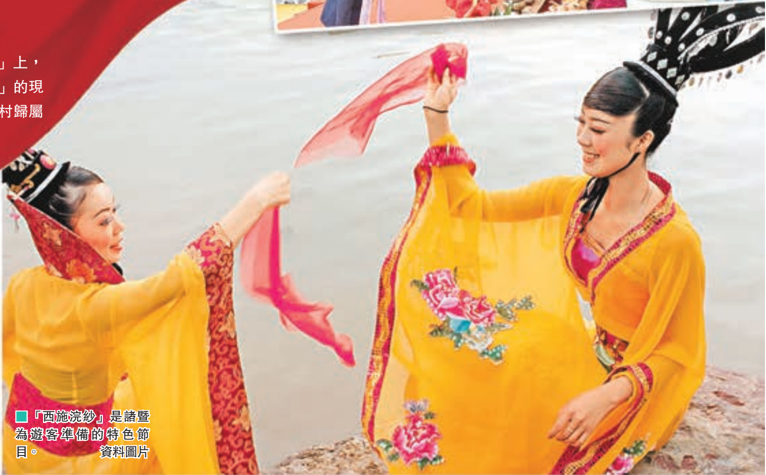
「西施浣紗」是諸暨 為遊客準備的特色節 目。