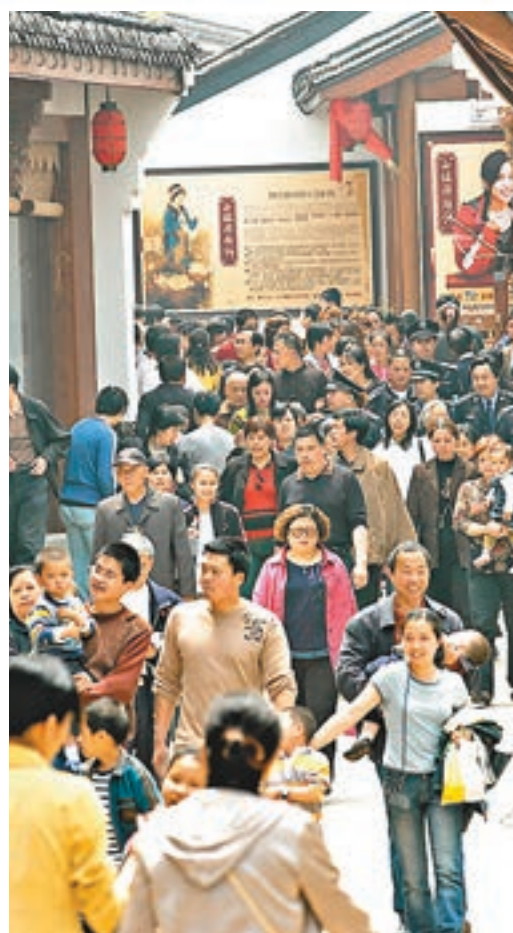
故里經濟發展得好，可吸引眾多遊人前來。圖為諸暨遊人如織。 資料圖片