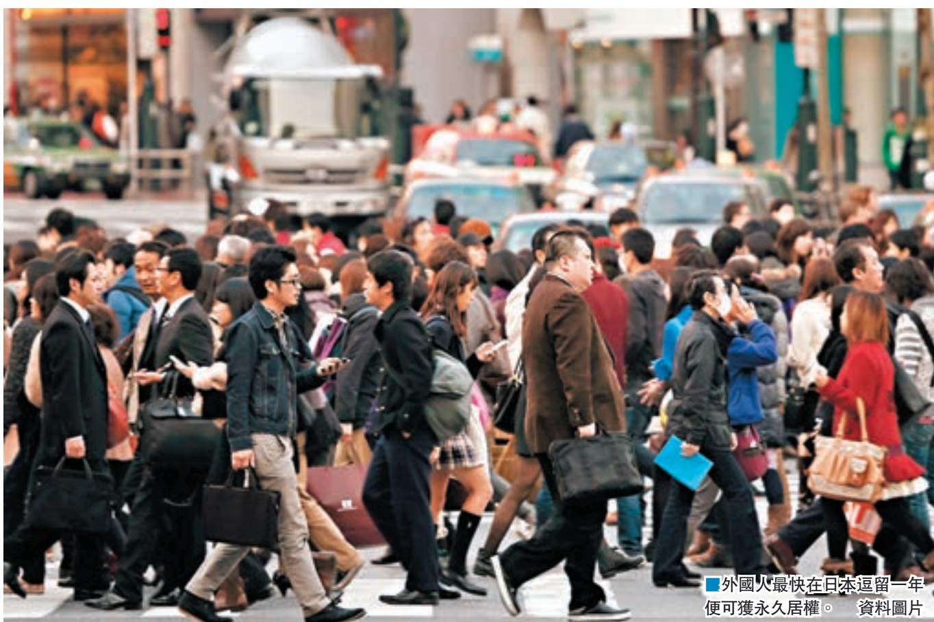
外國人最快在日本逗留一年便可獲永久居權。

香港文匯報訊(記者 李鍾洲) 人才需求競爭愈趨激烈,《日本經濟新聞》早前報道,日本政府將推出新制度,規定擁有專業知識的外國高級人才,只要在日本逗留3年,就能取得永久居留權,當中具有高水平經營的人才(高級行政人員和企業家),最短更只需逗留1年便可獲批永久居留權,較此前的5年期限大幅縮短,成為全球最低門檻的永久居留資格申請制度,以吸納外國人在研究開發等方面的高級技術。