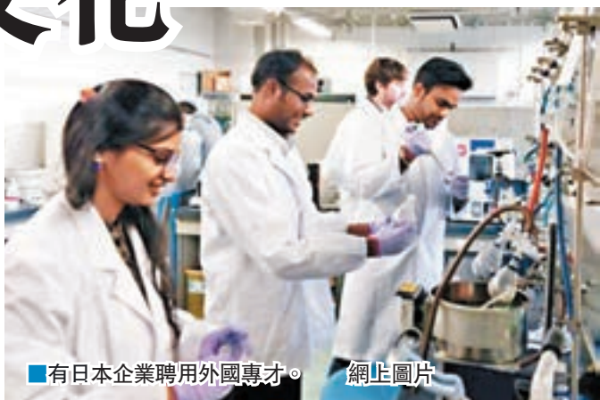
有日本企業聘用外國專才。網上圖片

安倍的顧問山島彥認為,近年到日本旅遊的外國人愈來愈多,有日本人覺得難以接受也是意料中事,「部分日本人會心想:『外國人多了對日本好嗎?』」他又將日本的情況與歐洲