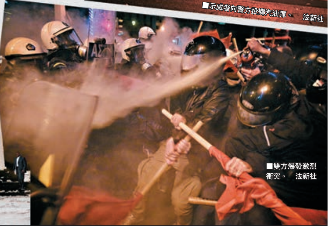
雙方爆發激烈衝突。