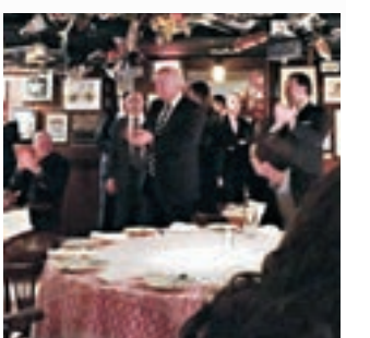
特朗普到餐廳用膳。