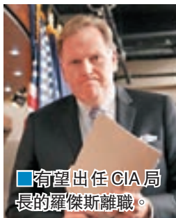
有望出任CIA局長的羅傑斯離職。

美國候任總統特朗普籌組管治班子的工作一波三折，繼過渡團隊領導層日前忽然改組後，原本有望出任中央情報局(CIA)局長的溫和派前共和黨眾議員羅傑斯等成員，前日亦相繼離職，令組閣工作再添變數。由於人事變動不斷，過渡團隊需要重新向白宮提交相關文件，導致政權交接工作嚴重滯後。英國《金融時報》更指這情況已演變成外交問題，包括中國在內的多國駐美大使都投訴無法與特朗普團隊取得接觸。