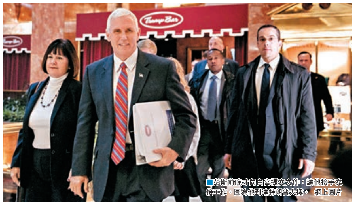
彭斯前晚才向白宮提交文件，讓他接手交接工作。圖為他到蓬佩奧大樓。

共和黨在上週大選保住國會參眾兩院控制權，共和黨眾議員前日一致提名瑞安連任眾議院議長。儘管瑞安在競選期間曾與特朗普劃清界線，予共和黨內部嚴重分化之感，但從該黨全體眾議員一致提名瑞安連任，反映共和黨內部重現團結。■路透社/美聯社/法新社/《紐約時報》/《華爾街日報》