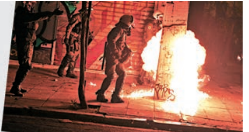
示威者向警方投擲汽油彈。