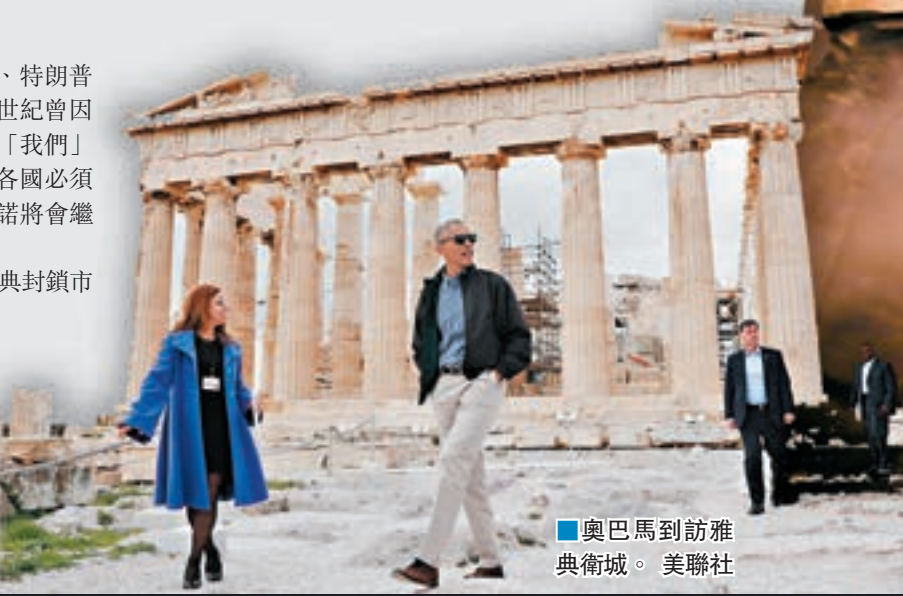
奧巴馬到訪雅典衛城。