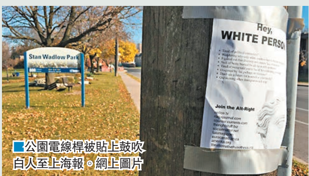
公園電線桿被貼上鼓吹白人至上海報。

加拿大多倫多市附近一個公園的電線桿上，近日被貼上鼓吹白人至上及反對移民的海報，並號召展開名為「alt-right」(另類右派)的運動。警方表示已介入調查海報的來龍去脈。