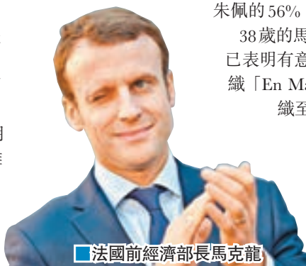
法國前經濟部長馬克龍