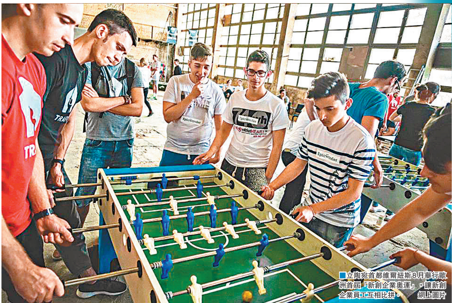
立陶宛首都維爾紐斯8月舉行歐洲首屆「新創企業奧運」，讓新創企業員工互相比拼。