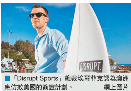
「Disrupt Sports」總裁埃爾菲克認為澳洲應仿效美國的簽證計劃。

澳洲總理特恩布爾去年9月上台後，矢言要令澳洲成為充滿創意的國家，但澳洲對外國移民存在恐懼情緒，令吸引外國專才到澳洲創業的「企業家簽證」進展緩慢。有企業家呼籲澳