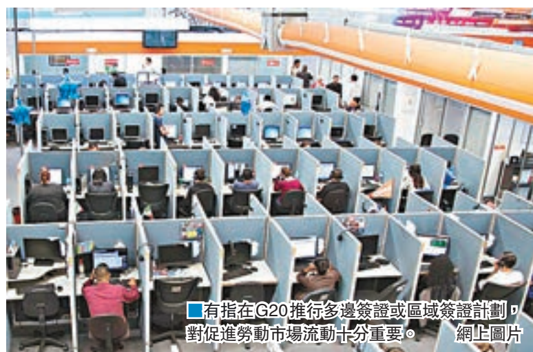
有指在G20推行多邊簽證或區域簽證計劃，對促進勞動力市場流動十分重要。