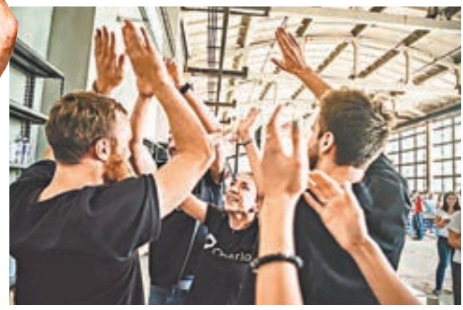
「新創企業奧運」加深各新創企業間的聯繫，更有助建立團隊精神。