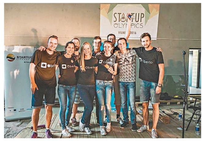
「新創企業奧運」冠軍隊伍。網上圖片