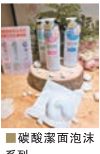
碳酸潔面泡沫系列

美麗肌膚由潔面開始，來自日本的Bifesta一直以來透過一系列的卸妝產品，實踐「Cleansing for Beauty」之品牌理念，希望讓每位女士透過卸妝潔膚，為美麗肌膚打好基礎。繼卸妝產品後，品牌早前更推出全新潔面系列——碳酸潔面泡沫，全方位照顧不同的潔面護膚需要，讓女士們於忙碌生活中，都能擁有潔淨亮肌。