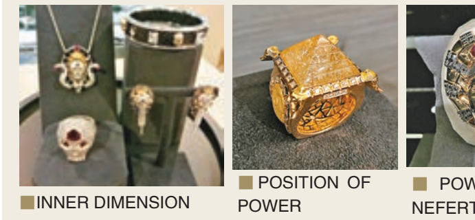
INNER DIMENSION POSITION OF POWER POWER OF NEFERTITI 每款首飾附送的設計手稿

Pat在接受訪問時提到，這是他首次參與珠寶的設計，但整個過程都很順利，他非常享受是次經驗，日後有機會定必會再參與珠寶設計。相比起畫漫畫，他認為珠寶設計更講究準繩度，每一小節都必須完美無瑕；反之，漫畫創作則有較大彈性，故事性較濃。 最後，Pat也分享了他對中外創作環境差異的看法。他認為加拿大的生活雖然寧靜安逸，但他較享受在亞洲城市——尤其是香港工作。他認為香港作為動感之都，繁忙的大街小巷每天都發生着新奇有趣的事情，是他創作的靈感之泉。而且美國的漫畫市場相對飽和，競爭激烈。相反，香港和內地市場例如上海，則有很多不局限於漫畫創作的工作機遇，這也是他遷居香港的原因之一。至於Pat日後還會如何「跨界」一展所長，就讓我們一起拭目以待！