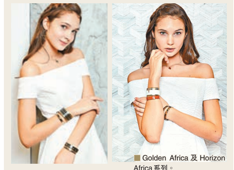
Golden Africa及Horizon Africa系列