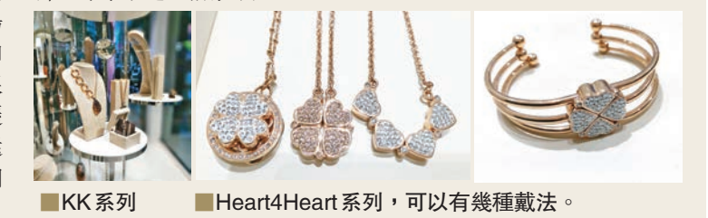
KK系列 Heart4Heart系列，可以有幾種戴法。