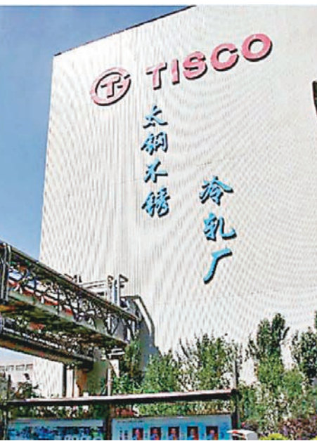
圖為太鋼不銹冷軋廠。

2016年前三季度,太鋼不銹進一步優化產品結構,提升產品質量,加大降本增效力度,加之鋼材市場回暖,在鋼產量同比有所上升的情況下,經營業績與上年同比扭虧為盈,實現利潤總額7.59億元人民幣,歸屬上市公司股東淨利潤8.42億元人民幣。