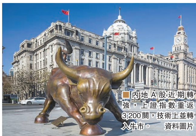
內地A股近期轉強,上證指數重返3,200關,技術上並轉入牛市。資料圖片

他建議,面對接下來可能的高位震盪,投資者不妨以定期定額策略,降低選時風險;以定期定額方式投資中小型A股(中證500指數),一年累計回報率平均為12.11%,正回報率約為7成;若將定期定額時間拉長至三年,則正回報率率達100%,累積回報率平均達57%,平均年化回報率超過16%。