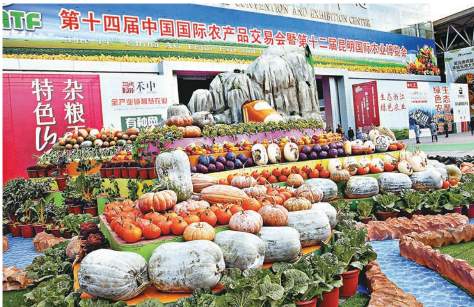
第十四屆農交會於昆明開門迎客。

一場「省部長聯合推介品牌農產品活動」拉開了第十四屆中國國際農產品交易會的序幕,來自農業部、內地多個省份的20位主管農業的省部長集中亮相,聯合為品牌農產品代言。