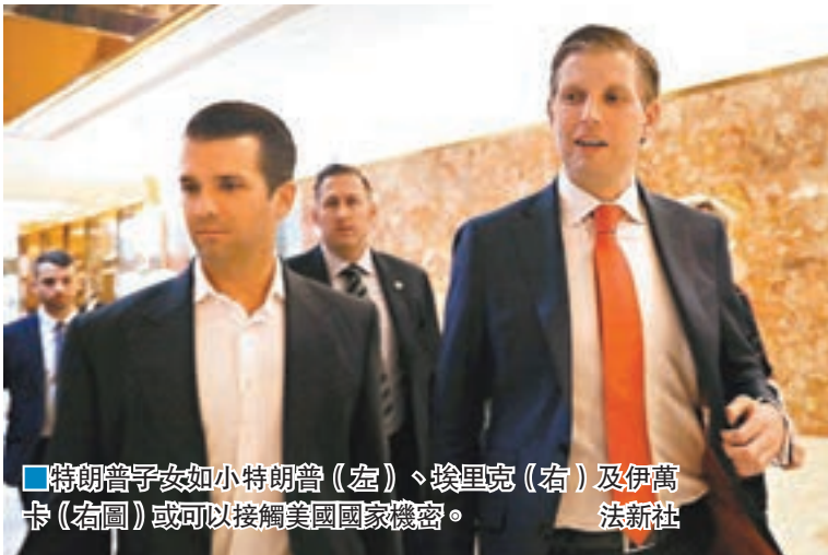
■特朗普子女如小特朗普(左)、埃里克(右)及伊萬卡(右圖)或可以接觸美國國家機密。