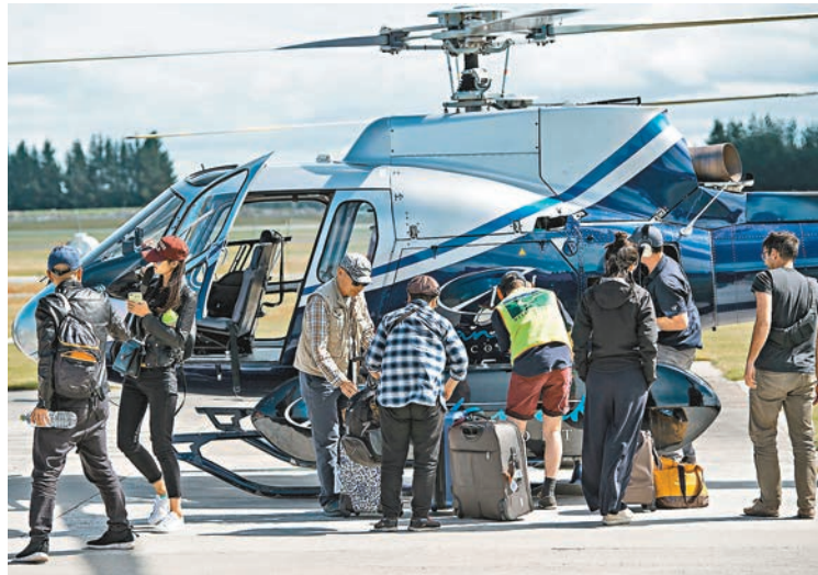
■中國遊客乘坐直升機抵達安全地方。