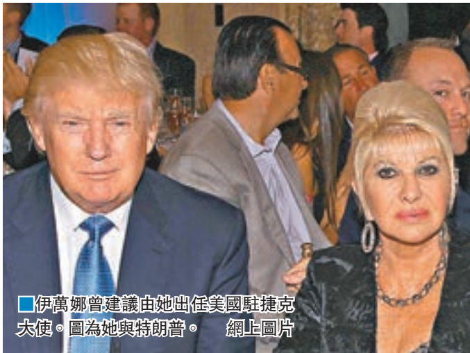
■伊萬娜曾建議由她出任美國駐捷克大使。圖為她與特朗普。