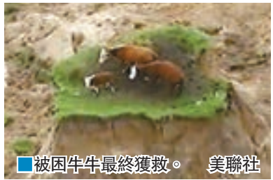
■被困牛牛最終獲救。