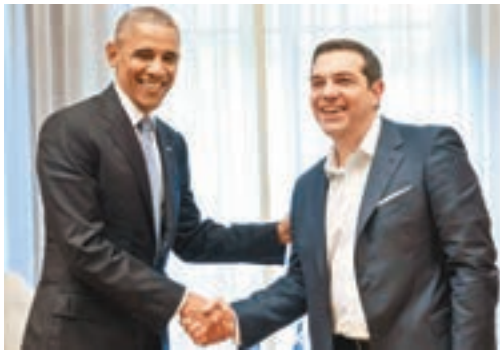
■奧巴馬與希臘總理齊普拉斯會面。