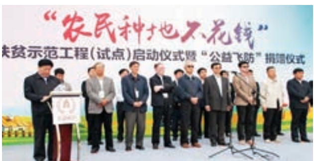
■「農民種地不花錢」項目啟動儀式現場。本報北京傳真

周口等地已經得到初步推廣。據測算，農民每畝小麥種植成本400元左右，「農民種地不花錢」模式通過集約化生產，每畝可降低種植成本約80元，通過訂單農業每畝可節約採購成本40元，通過網上銷售環節每畝可增加利潤300元。「農民種地不花錢」扶貧示範工程項目在反哺農民的時候，並不影響企業的銷售利潤。而農民每畝單季可直接增收460元，其中種植成本節約400元，小麥銷售增加60元。