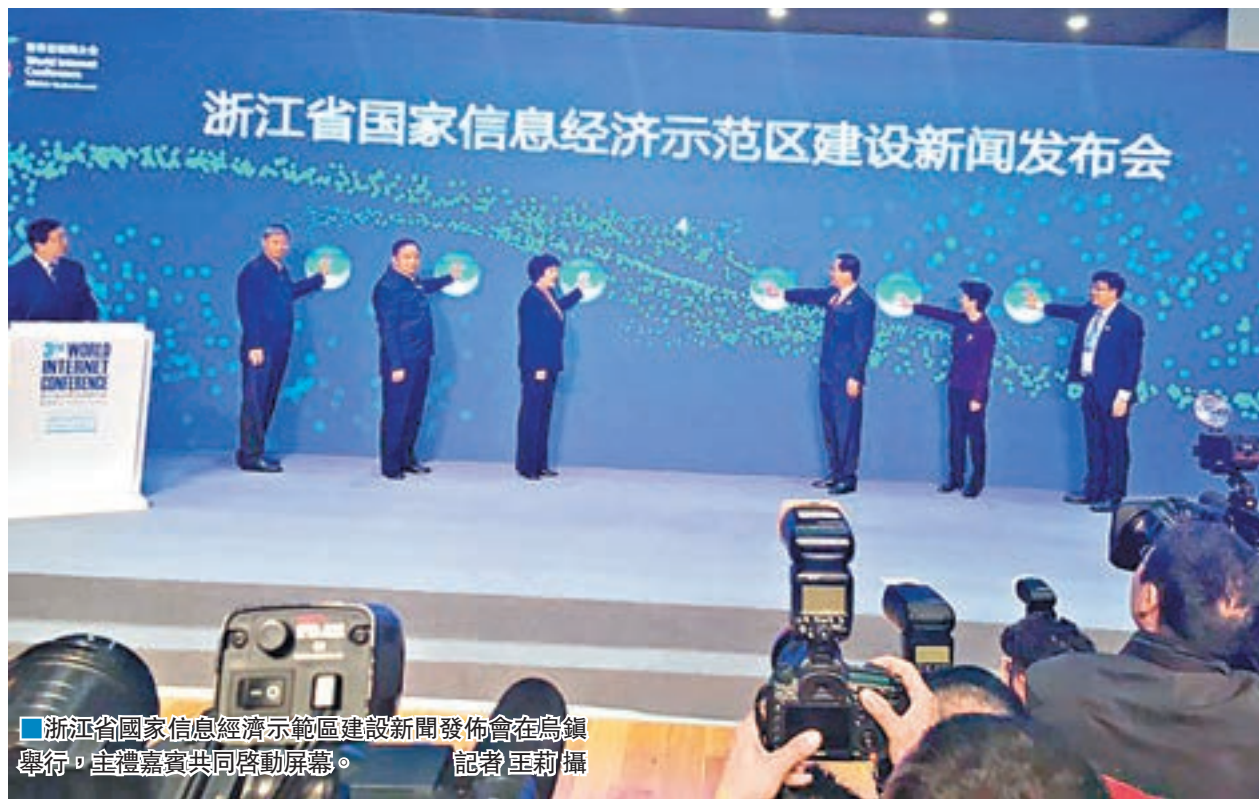
浙江省國家信息經濟示範區建設新聞發佈會在烏鎮舉行，主禮嘉賓共同啟動開幕。

據國家網信辦信息化發展局副局長鍾世龍介紹，該博覽會定位於「國際、創新、未來、體驗、融合」五大理念，展區面積約2.1萬平方米，共設置發展理念區、綜合展區、主題展區、新產品新技術發佈區、項目合作洽談區等。知名互聯網企業和創業創新企業將在博覽會期間展示其新技術、新產品、新應用，展現互聯網在經濟、社會、文化、生態等領域應用和融合發展衍生的新模式與新生態。同期將舉行118場新技術、新產品發佈活動和5場項目合作洽談活動。