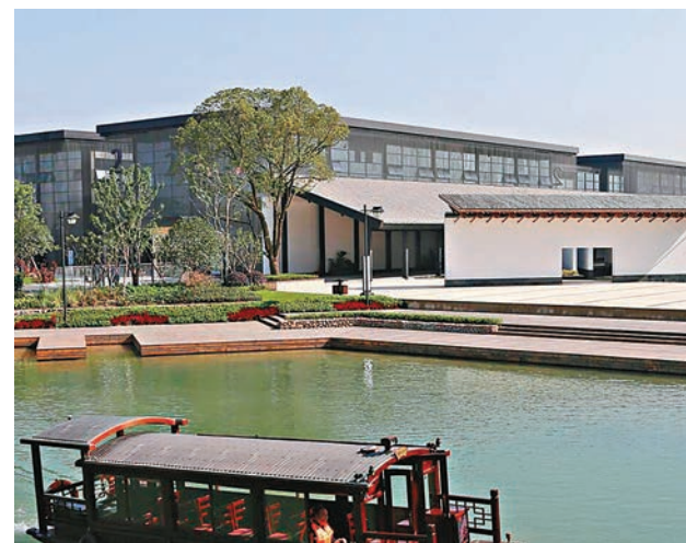
烏鎮互聯網國際會展中心。

據悉，會展中心由普利茲克建築獎得主、中國美院教授王澐設計。會址以水為媒，三座主要建築沿南、東、北三個方向圍繞中心水池而建，整體建築融入大量白牆黛瓦、臨水連廊等經典江南水鄉特色元素，外立面上採用260萬片江南小青瓦，5.1萬根鋼索以網狀肌理寓意互聯網，凸顯傳統文化與現代文明的融合共生。