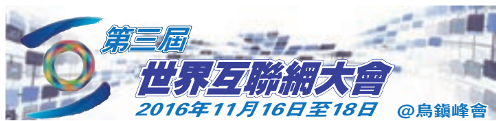
香港文匯報訊 (綜合本報記者王莉及新華社報道) 第三屆世界

互聯網大會於今日起一連三天在浙江烏鎮舉行。浙江省國家信息經濟示範區建設啟動儀式昨日在烏鎮舉行，這是全國首個國家信息經濟示範區。據了解，示範區將大力發展網絡信息核心技術，加強關鍵信息基礎設施安全保障，完善網絡治理體系，以信息化培育新動能，用新動能推動新發展。