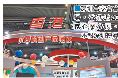
深圳高交會會場，香港近20家企業參展。本報深圳傳真

深圳高交會今年是第18屆。高交會組委會方面介紹，今年的高交會凸顯了技術風向標和行業風向標功能，將集中展示大批全球前沿科技領域尖端技術，例如全球領先的虛擬現實全息影像互動技術、智能語音交互技術、計算機視覺和深度學習技