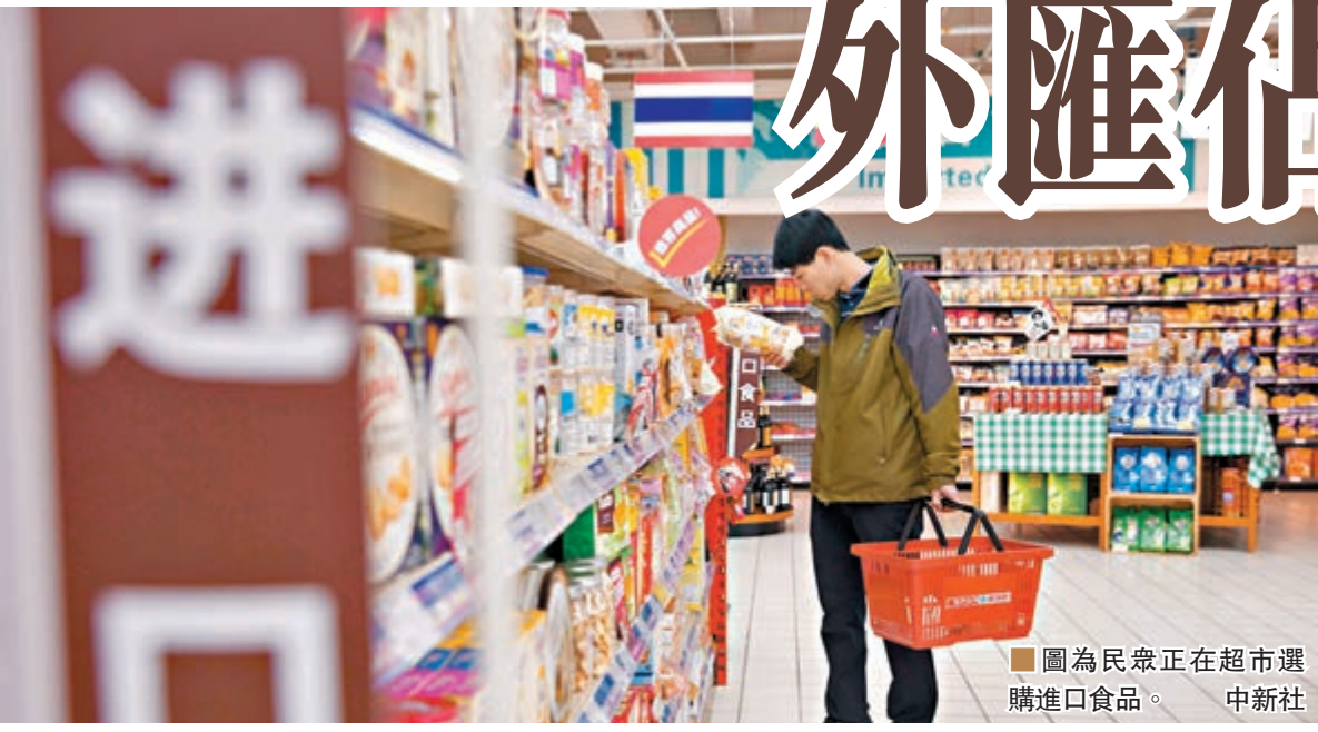
圖為民眾正在超市選購進口食品。中新社

香港文匯報訊(記者 涂若奔) 人民銀行昨日更新的資產負債表顯示,內地10月末人民幣外匯估款22.6萬億元(人民幣,下同),環比減少2,678.64億元,是外匯估款連續12個月下滑,但跌幅較9月份的3,375億有所收窄。另外,人民幣中間價昨日下午下調176點子,七連跌後逼近6.83關口。在岸即期CNY亦大跌逾400點子,失守6.84關口,過去三個交易日累跌1%。