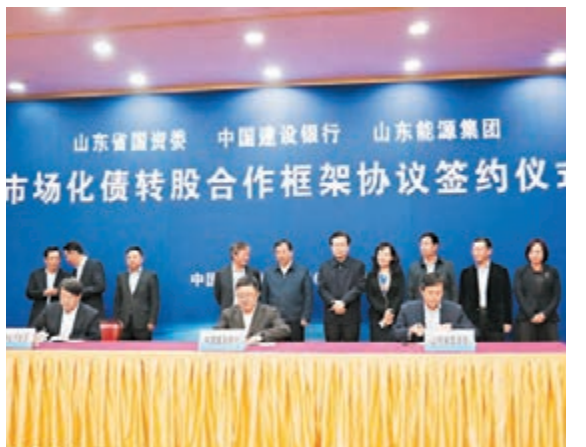
建設銀行與山東能源簽署210億元市場化債轉股合作協議。

據其介紹,針對「一煤獨大」的產業結構失衡問題,山東能源集團近年抓傳統產業改造提升的同時,着手抓新興產業培育壯大,加快打造形成大能源、大金融、大服務「三大產業」格局,構建煤電、新興地產與醫養結合、產融結合「三大一體化產業鏈」和建設新疆伊犁、內蒙古上海廟、山東萊蕪與海澤「四大基地」發展新佈局。