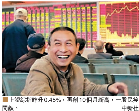
上綜指昨升0.45%,再創10個月新高,一般民笑開顏。

香港文匯報訊(記者 章蘿蘭 上海報導) 近日A股市場情緒偏暖,常走出「獨立行情」。人民幣對美元中間價七連跌,商品期市亦巨震,但滬指收市依然升0.45%,不但站上3,200點整數關口,且再度刷新10個月新高。奧巴馬放棄任內通過TPP(跨太平洋夥伴關係協定),觸發A股中韓自貿板塊飆升。