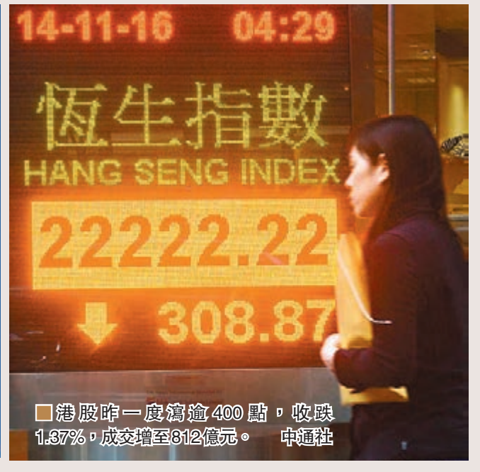
港股昨一度瀉逾400點，收跌1.37%，成交增至812億元。